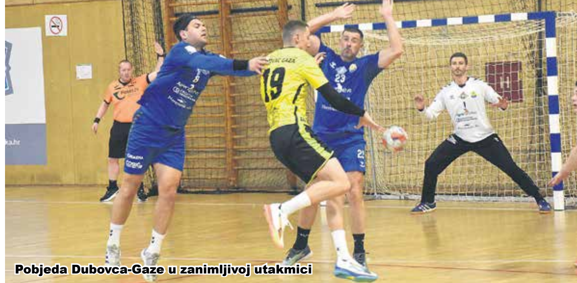
Pobjeda Dubovca-Gaze u zanimljivoj utakmici

Rukometaši "Dubovca-Gaze" pobijedili su u subotu u Sportskoj dvorani na Rakovcu u šesnaestom kolu Prve hrvatske rukometne lige Jug momčad "Opuzena" s 35:26, a nakon prvog poluvremena vodili su s 15:13. U domaćem sastavu nisu bili Hreljac, Pauli, Poljak i Raužan. U prvom poluvremenu Karlovčani su bili bolji i vodili su cijelo vrijeme, prednost je bila od dva do pet pogodaka, bilo je 20:5 i 15:11, gosti su u završnici postigli dva pogotka. Na odmor se otišlo s 15:13 za domaću momčad. U