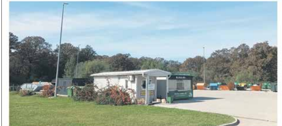
Reciklažno dvorište Ilovac i otkup ambalažnog otpada (Zagrebačka 17d)