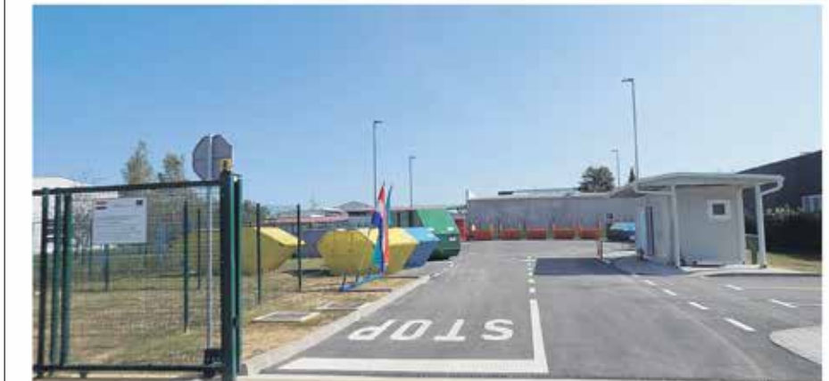
Reciklažno dvorište Mala Švarča (Ul. dr. Slavka Rozgaja 5a)