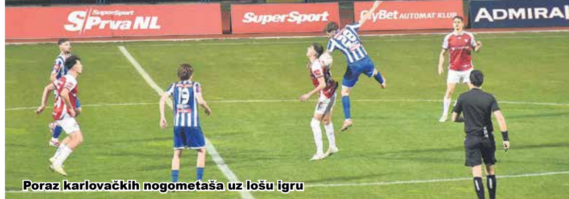
Poraz karlovačkih nogometaša uz lošu igru