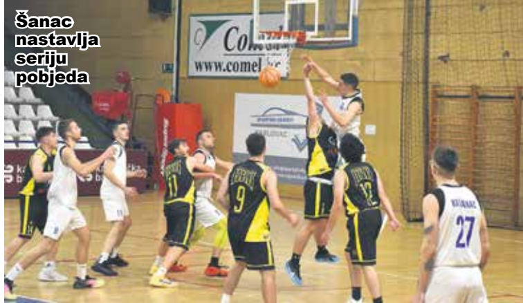
Šanac nastavlja seriju pobjeda