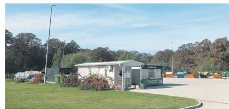
Reciklažno dvorište Ilovac i otkup ambalažnog otpada (Zagrebačka 17d)