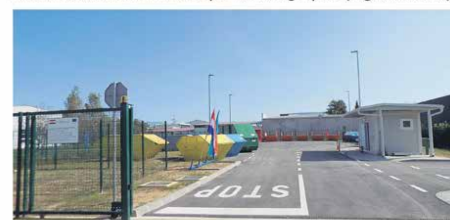
Reciklažno dvorište Mala Švarča (Ul. dr. Slavka Rozgaja 5a)