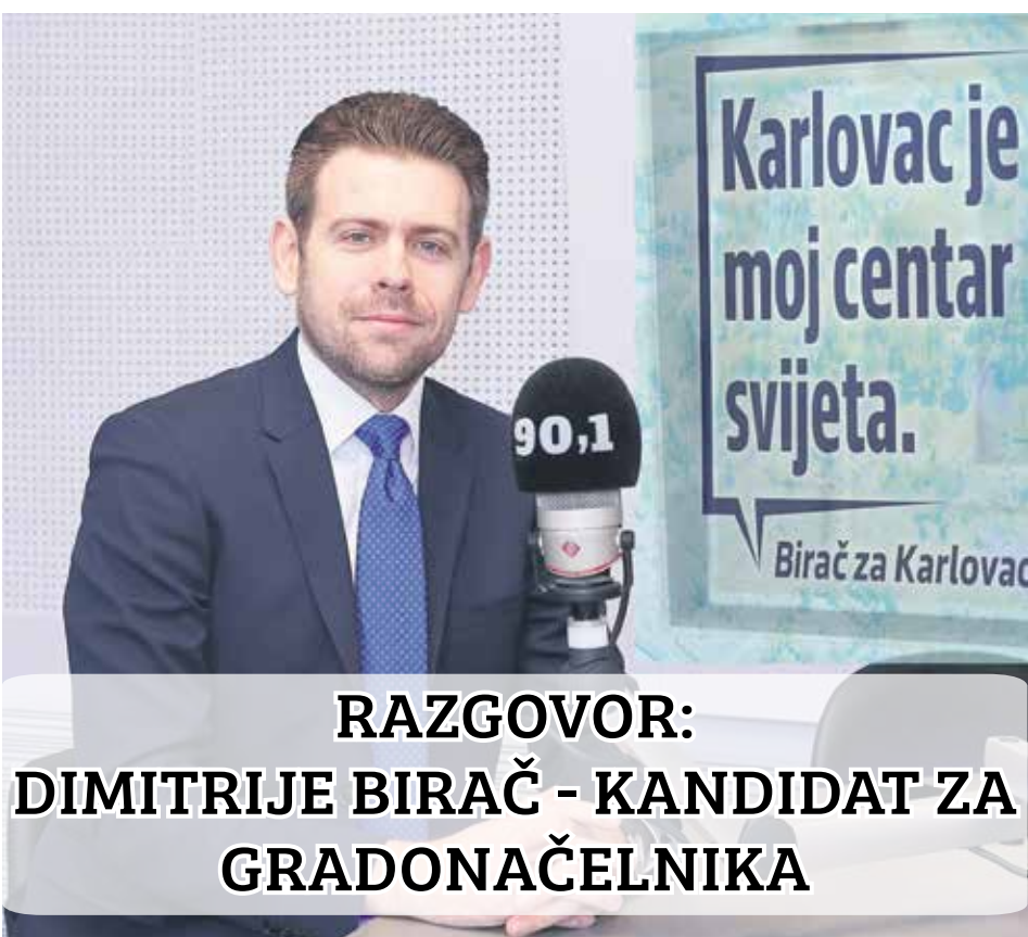
RAZGOVOR: DIMITRIJE BIRAČ - KANDIDAT ZA GRADONAČELNIKA