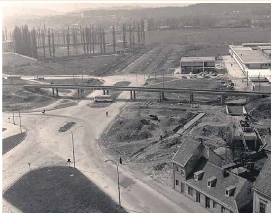
RETRO FOTOGRAFIJA - IZGRADNJA NOVOG CENTRA 1970.-tih