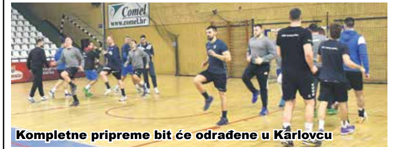
Kompletne pripreme bit će odradene u Karlovcu