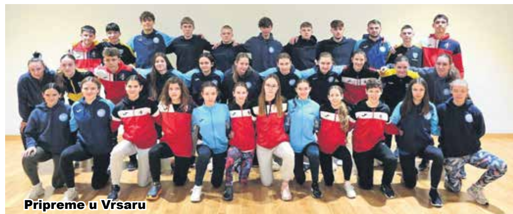
Pripreme u Vrsaru

Taekwondo klub "Prana" odradio je petodnevne pripreme u Vrsaru. Pripreme su počele 2. siječnja i trajale su pet dana, a odradene su zajedno s prijateljskim taekwondo klubovima "Dubrava", "Otočac", "Dugo Selo" i "Susedgrad Sokol". Natjecatelji su svoju formu podizali kroz tri treninga dnevno. Treninzi su se održavali u dvoranama Osnovne škole "Vladimir Nazor" i Sportskoj dvorani "Saline", uz korištenje teretane i bazena u sklopu hotela. Jako vrijedna ekipa dala je svoj maksimum, da što kvalitetnije započne natjecateljsku 2025. godinu. (b.o.)