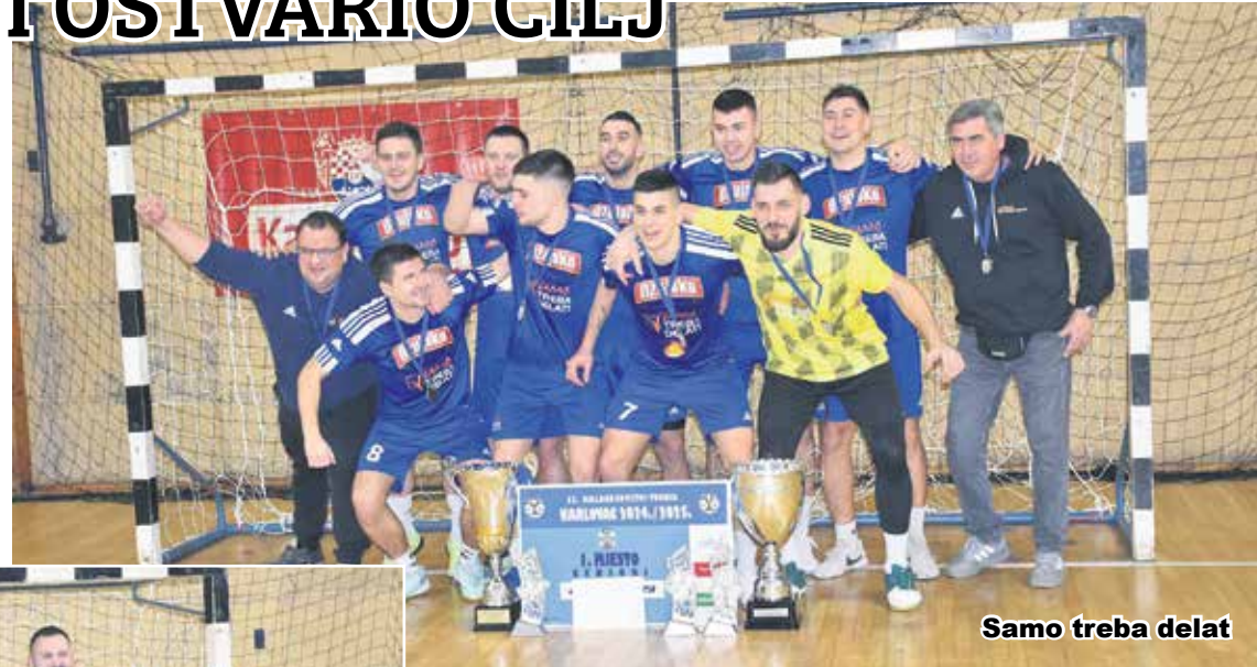
Samo treba delat

Mali nogomet i dalje živi u Karlovcu. Ekipe Samo treba delat i Samobora pobjednik je u konkurenciji seniora. U finalnom susretu ekipa Samo treba delat pobijedila je u subotu u Sportskoj dvorani na Rakovcu ekipu MNK Čegliji Autopraona Aqua-Blue sa 4:1. U susretu