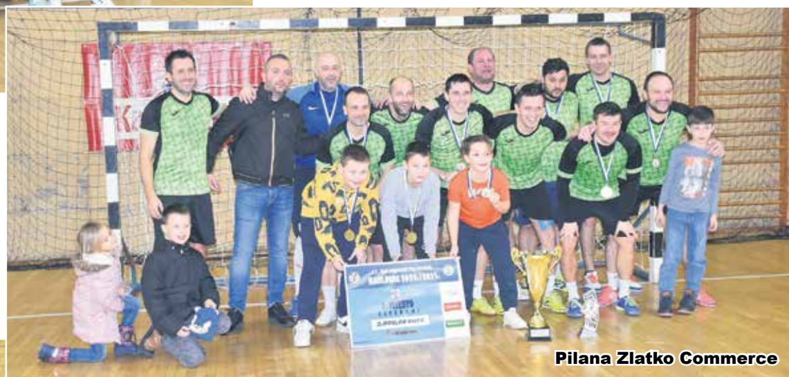
Pilana Zlatko Commerce