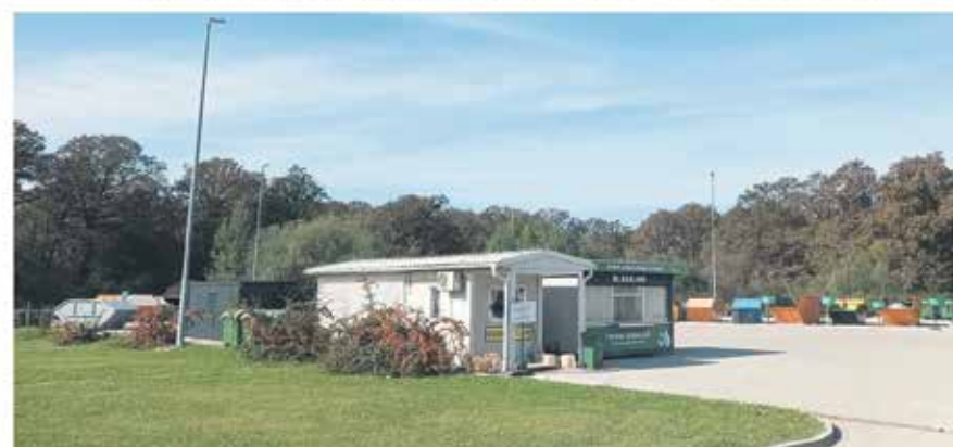
Reciklažno dvorište Ilovac i otkup ambalažnog otpada (Zagrebačka 17d)