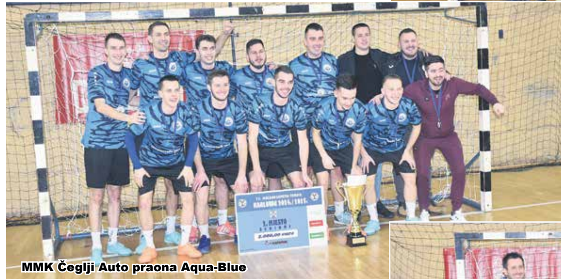
MNK Čegliji Auto praona Aqua-Blue

objekti Karlovac, a pokrovitelj Grad Karlovac. Organizacija turnira bila je odlična, utakmice turnira pratilo je veliki broj gledatelja, a svaki dan organizirana je tombola za publiku. Karlovački turnir vratio se nakon pet godina i ostvario cilj, publika se vratila u dvoranu.