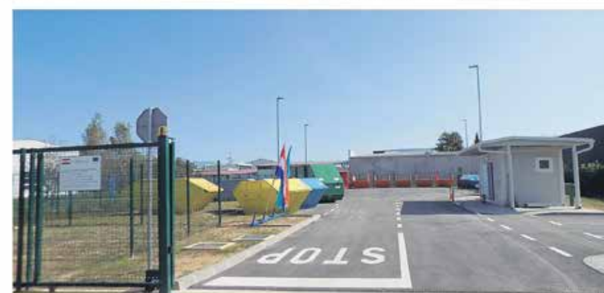
Reciklažno dvorište Mala Švarča (Ul. dr. Slavka Rozgaja 5a)