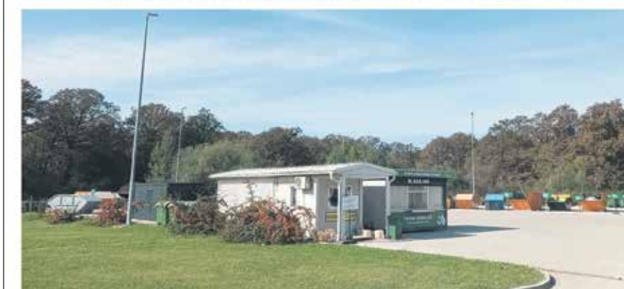
Reciklažno dvorište Ilovac i otkup ambalažnog otpada (Zagrebačka 17d)