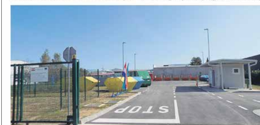
Reciklažno dvorište Mala Švarča (Ul. dr. Slavka Rozgaja 5a)