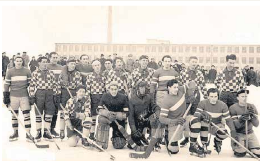
RETRO FOTOGRAFIJA - HOKEJ 18. VELJAČE 1940. PRIMORAC - ILIRIJA 2:6