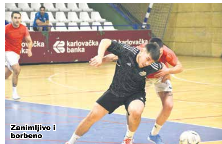
Zanimljivo i borbeno