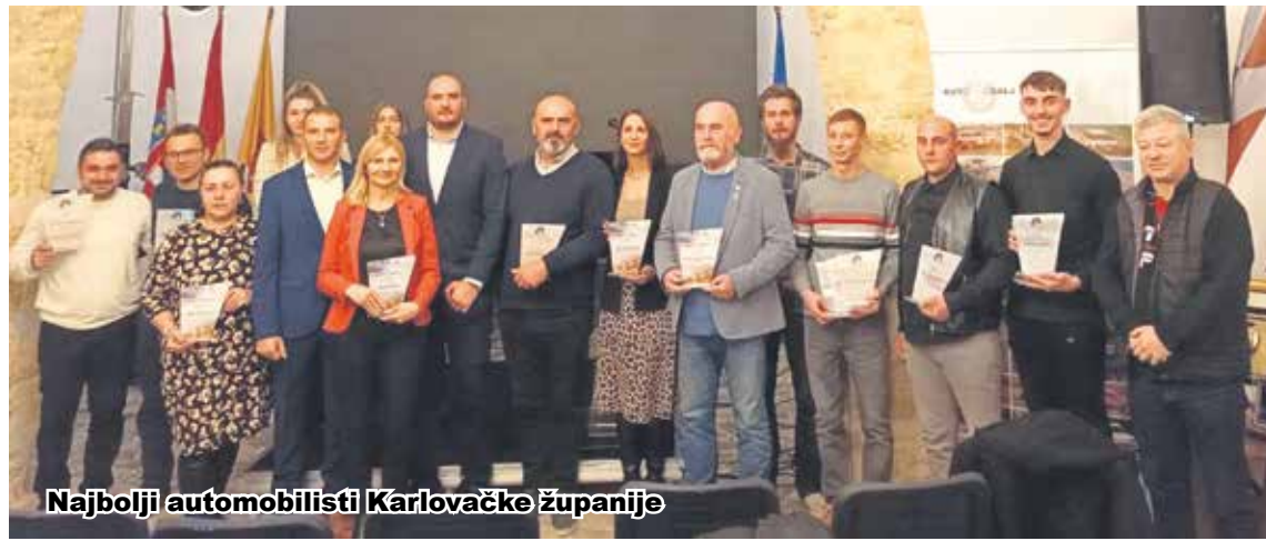
Najbolji automobilisti Karlovačke županije