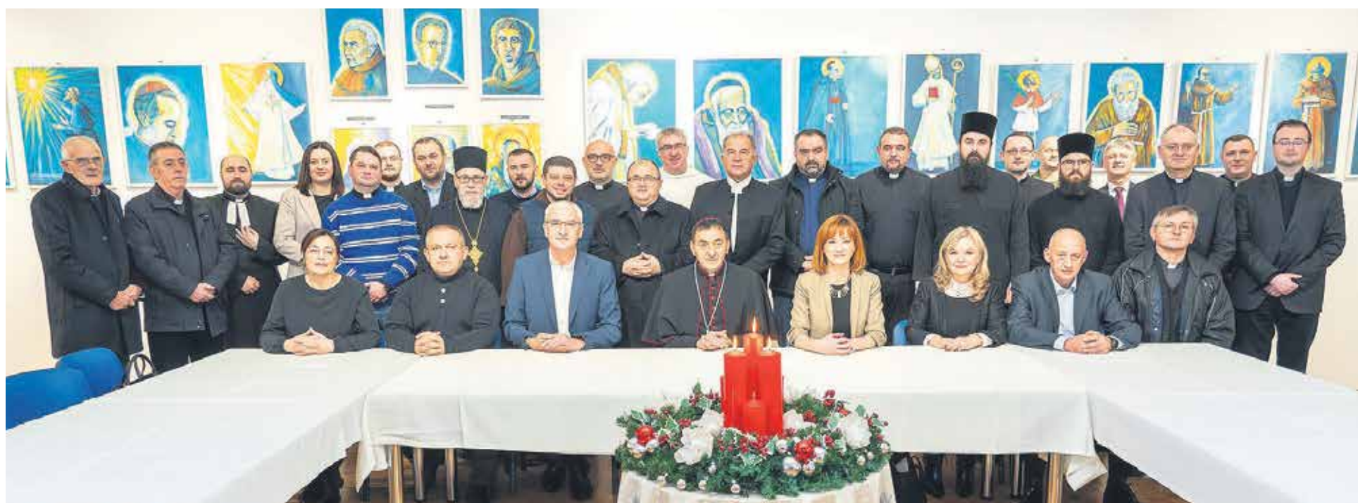
Prijam za predstavnike vjerskih zajednica