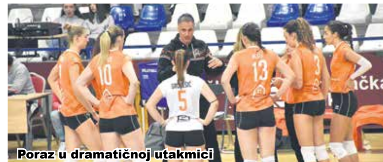
Poraz u dramatičnoj utakmici

Odbojkašice "Kelteksa" poražene su u subotu u Sportskoj dvorani na Rakovcu u devetom kolu Superlige za seniorke od ekipe "Osijeka". Gošće su pobijedile s 3:1, po setovima bilo je 23:25 29:27 21:25 24:26. Bila je to zanimljiva, ravnopravna i gotovo dramatična utakmica. Bio je to derbi začelja, susret važan za obje ekipe. U prvom setu bilo je 14:18, pa 20:20, a zatim su gošće odlično odigrale završnicu i dobile taj dio susreta s 25:23. U drugom setu opet velika borba, bilo je 6:10 i 10:14, zatim 17:17, 21:21, 23:23, 27:27, tada su domaće igračice osvojile dva poena i izjednačile na 1:1. U trećem setu bilo je izjednačeno do 15:15, a zatim su gošće povele s 22:16 i osvojile taj dio igre. U četvrtom setu bilo je neizvjesno i dramatično, ravnopravna igra, bilo je 11:11, 13:13, a kod 24:24 gošće su osvojile dva poena i došle do važne pobjede. Nakon devet odigranih kola i sedam poraza i dvije pobjede "Kelteks" je na devetom mjestu sa četiri boda. Devetim kolom završen je prvi dio prvenstva u Superligi za seniorke, drugi dio počinje 25. siječnja, a Karlovčanke gostuju u desetom kolu u Splitu kod ekipe "Brda". (b.o.)