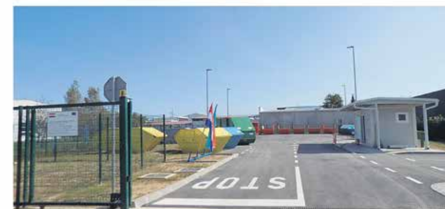
Reciklažno dvorište Mala Švarča (Ul. dr. Slavka Rozgaja 5a)