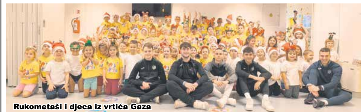
Rukometaši i djeca iz vrtića Gaza