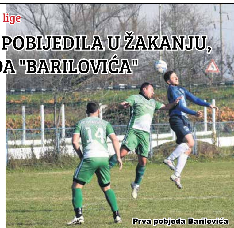
Prva pobjeda Barilovića

Oigrani su susreti četrnaestog kola, posljednjeg jesenskog. Prve županijske nogometne lige Nogometnog saveza Karlovačke županije. Postignuti su sljedeći rezultati: "Barilović" - "Vatrogasac" 3:1, "Zrinski Ozalj" - "Slunj" 2:1, "Croatia 78" - "Ogulin" 2:0 i "Duga Resa 1929" - "Dobra" Novigrad 0:3. Jesenski prvak je "Ogulin" s 34 boda, drugi je "Zrinski Ozalj" s 27 bodova, treća je "Croatia 78" s 26 bodova i utakmicom manje, a četvrti "Vatrogasac" s 22 boda. U subotu, 23. studenog od 13 sati i 30 minuta u zaostalom susretu osmog kola u Belavićima se sastaju "Dobra"Novigrad - "Croatia 78". U trinaestom kolu, posljednjem jesenskom, Druge županijske nogometne lige rezultati su bili sljedeći: "Franko-