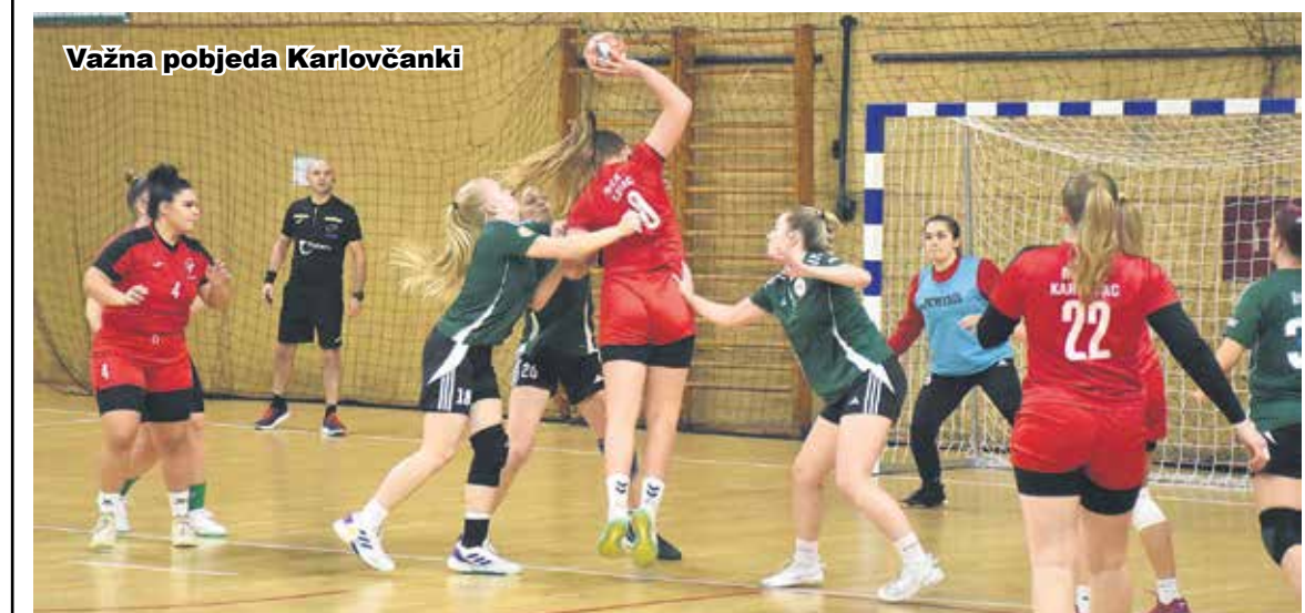
Važna pobjeda Karlovčanki

Seniorke Rukometnog kluba Škola rukometa Karlovac pobijedile su u nedjelju u Sportskoj dvorani na Rakovcu u devetom kolu Druge hrvatske rukometne lige zapad za žene ekipu "Trešnjevku Zagreba" s 24:22. Nakon prvog poluvremena bilo je 14:11 za domaću ekipu. Karlovčanke su preuzele inicijativu i vodile do kraja prvog poluvremena, na odmor se otišlo s plus tri za domaće igračice. U drugom po-