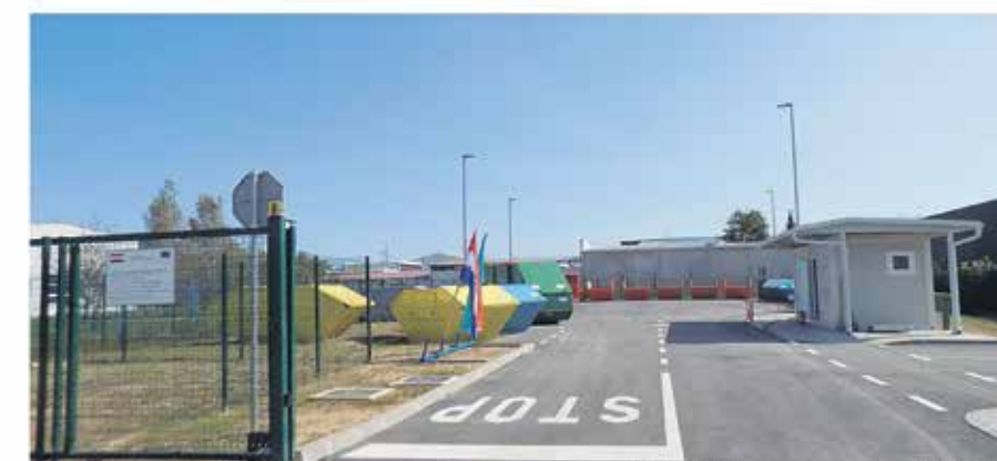
Reciklažno dvorište Mala Švarča (Ul. dr. Slavka Rozgaja 5a)