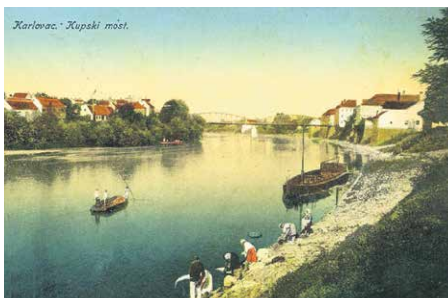
RETRO RAZGLEDNICA - KUPSKI MOST