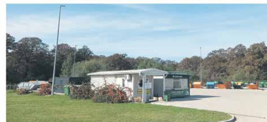
Reciklažno dvorište Ilovac i otkup ambalažnog otpada (Zagrebačka 17d)