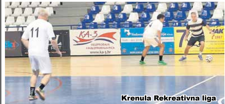
Krenula Rekreativna liga

Prošli tjedan je u Sportskoj dvorani na Rakovcu počela 7. Rekreativna malonogometna liga u kojoj sudjeluje trinaest momčadi. Proteklog tjedna odigrani su susreti prvog kola, a postignuti su sljedeći rezultati: Hitna medicina - VACON 1:0, SD HEP Karlovac - GE VERNOVA 1:1, Ceste Karlovac - Tvornica plinskih turbina 2:3, Heineken Hrvatska - Udruga trenera Nogometnog saveza Karlovačke županije 0:8, Karlovačka banka - SU Veleučilište Karlovac 2:2 i TTK Karlovac - Policijska uprava karlovačka 0:4. U prvom kolu slobodna je bila Inženjerijska pukovnija. (b.o.)