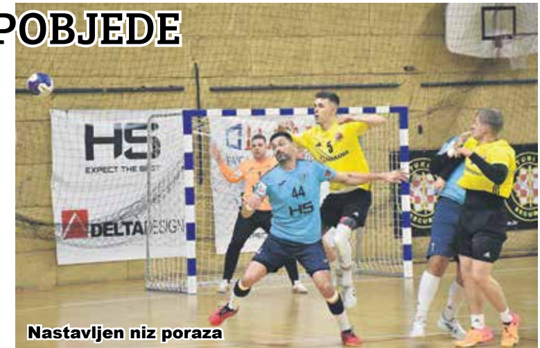
Nastavljen niz poraza

Rukometnaši "Karlovca" poraženi su u subotu u Sportskoj dvorani na Rakovcu u desetom kolu Paket24 Premijer lige od momčadi "Dubrave" iz Zagreba. Gosti su pobijedili s 29:24, a nakon prvog poluvremena vodili su s 15:11. Ova utakmica bila je izuzetno važna za domaće rukometaše, pobjeda im je bila imperativ. No, kao i u većini utakmica ove sezone nije išlo, uvijek nešto zakaže, ovaj put obrana je bila dobra, vratari dobri, ali je realizacija bila ispod svake razine. Od rezultata 3:3 gosti su preuzeli inicijativu i vodili do kraja susreta, uglavnom je razlika bila od tri, pa do sedam pogodaka. Ovi bodovi bili su izuzetno važni karlovačkim rukometašima, ali oni jednostavno nisu bili dovoljno koncentrirani i spremni da ih uzmu. Trenerica Tatjana Rašić istaknula je da je nervoza u njezinoj momčadi presudila u ovom susretu. -Znamo svi što nam je značila ova utakmica, koliko nam je bila bitna, pritisak je bio ogroman, nervoza, na kraju se