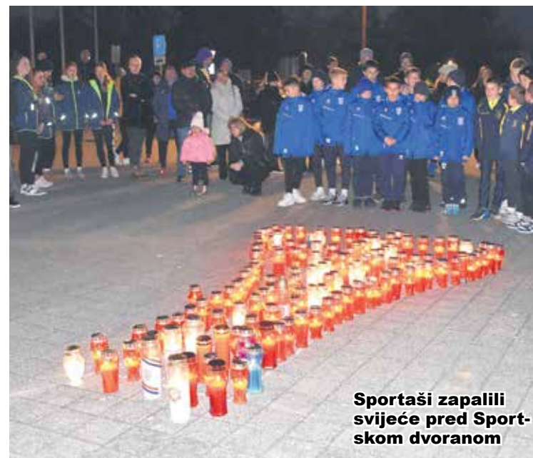
Sportaši zapalili svijeće pred Sportskom dvoranom