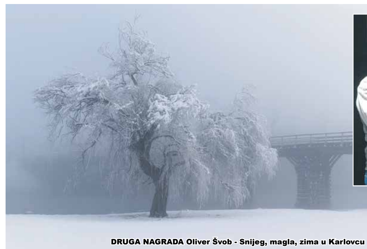
DRUGA NAGRADA Oliver Švob - Snijeg, magla, zima u Karlovcu