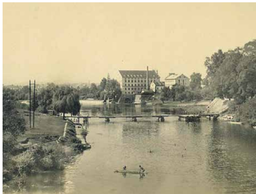
RETRO RAZGLEDNICA - KORANA