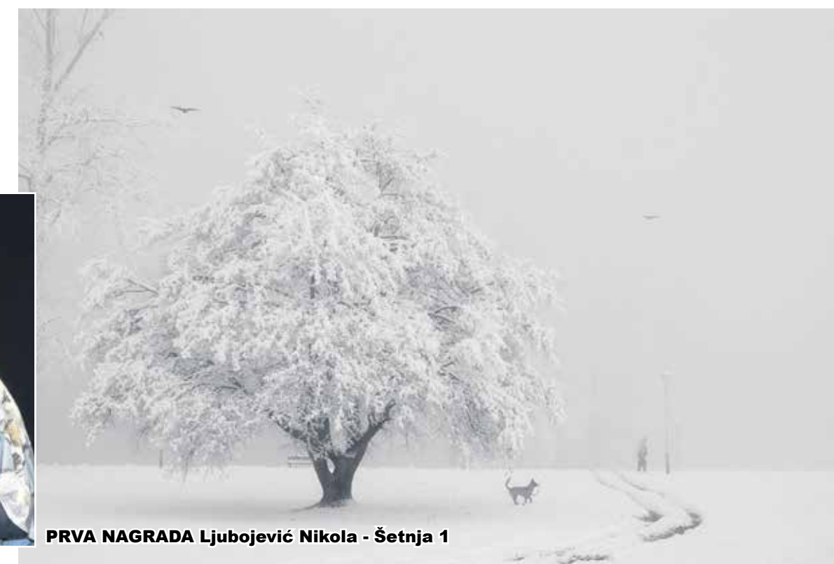
PRVA NAGRADA Ljubojević Nikola - Šetnja 1

Festival je imao i program za djecu koja su na Odjelu za djecu i mladež Gradske knjižnice izra-