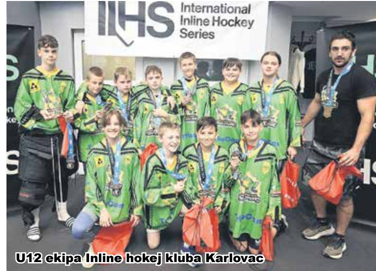
U12 ekipa Inline hokej kluba Karlovac

U gradu Mlada Boleslav u Češkoj od 1. do 7. srpnja održan je zanimljiv turnir u inline hokeju pod nazivom International Inline Hockey Series (IIHS). Među brojnim timovima koji su sudjelovali, posebno se istaknuo Inline hokej klub "Karlovac", koji je nastupio u kategoriji U12. Ovaj turnir bio je prava prilika za mlade igrače da pokažu svoje vještine i natječu se s vršnjacima iz različitih dijelova Europe. Inline hokej klub "Karlovac" bio je u skupini s jednom češkom ekipom i jednom ekipom iz Španjolske. Obje ekipe bile su vrlo jake, okupljajući najbolje igrače iz svojih regija. Hokej je općenito puno razvijeniji u tim krajevima, što je dodatno otežalo natjecanje za mlade Karlovčane. Unatoč tome, mladi igrači iz Karlovca pokazali su izvanrednu borbenost i vještinu. Nakon napetih utakmica i velike borbe, osigurali su brončanu medalju na kraju turnira. Ovaj rezultat predstavlja veliki uspjeh za Karlovac, s obzirom na kvalitetu protivničkih ekipa i njihovog iskustva u sportu. Posebno se istaknuo golman