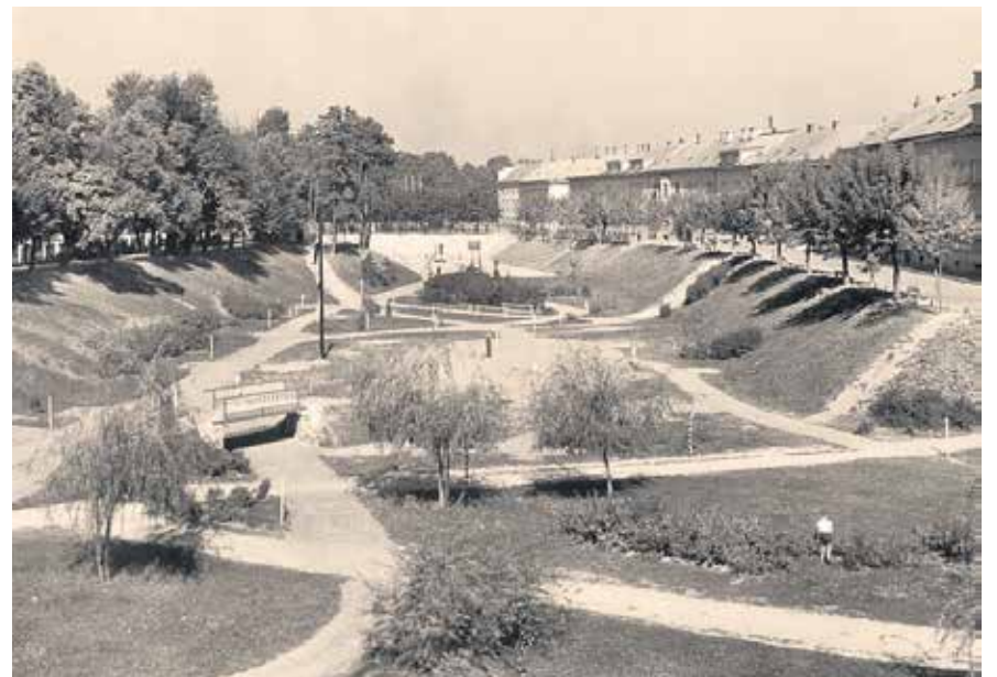
RAZGLEDNICA – PARKOVI 1960.