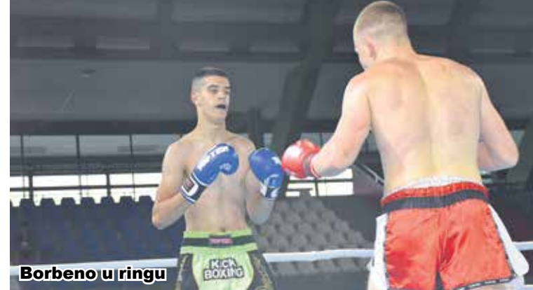
Borbeno u ringu