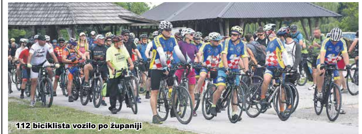
112 biciklista vozilo po županiji

Sportsko rekreacijski klub "Pedala laganini" organizirao je u nedjelju tradicionalnu 13. biciklijadu "Karlovačke 4 rijeke - Memorijal Želimira Grbića Grbe" povodom 445. rođendana Grada Karlovca, a u sklopu Zvezdanog ljeta. Start biciklijade bio je u 8 sati na prostoru Sportsko rekreacijskog centra Korana. Trasa biciklijade bila je ŠRC Korana - Logorište - Barilović - Siča - Petrunići - Generalski Stol - Lešće - Bosiljevo - Jarče Polje - Tomašnica - Jaškovo - Brodarci - Borlin - Karlovac - ŠRC Korana. Sudjelovalo je ukupno 112 biciklista. Ukupna dužina trase iznosila je 90 kilometara. Startnina je iznosila 20 eura, putem koje svaki biciklist dobio voće, osvježavajuće napitke, slastice i ručak. Povratak biciklista bio je oko 18 sati. (b.o.)