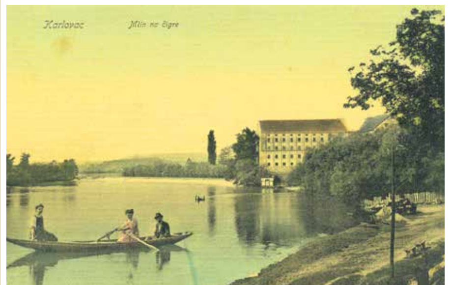
RAZGLIEDNICA – MLIN NA ČIGRE (putovala 1909. godine)