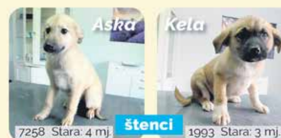
7258 Stara: 4 mj. štenci 1993 Stara: 3 mj.

Sklonište za napuštene životinje UTINJA 12