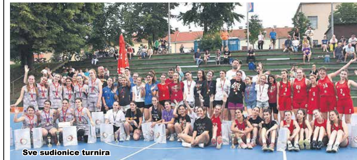
Sve sudionice turnira

Ženski košarkaški klub "Karlovac" organizirao je u nedjelju na igralištu u Šancu Prvi ženski košarkaški turnir za djevojčice do šesnaest godina "Dream big!". U polufinalnim susretima postignuti su sljedeći rezultati: "Karlovac" - "Jabuka" Zaprešić 47:31 i "Falcons" Zagreb - "Folka Borovje" Zagreb