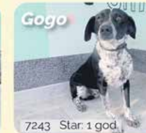
7243 Star: 1 god.