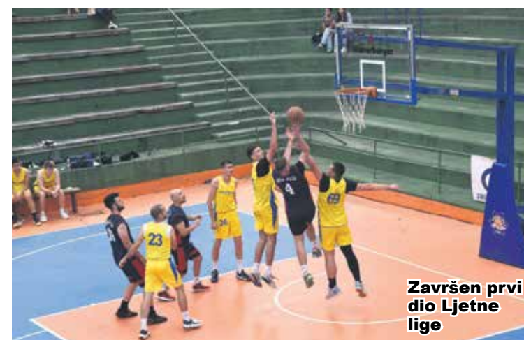
Završen prvi dio ljetne lige

U petak su na igralištu u Šancu odigrani susreti sedmog kola Karlovačke ljetne košarkaške lige. Postignuti su sljedeći rezultati: Kemigal Warriors – Auto lim-lak 54:37, Caffe bar König – Škanjci Mars 59:57, Novi centar – Lavići 67:63 i Rakovac – Hollywood Caffe 47:69. U sedmom kolu slobodna je bila Duga Resa. Nakon sedmog kola u vodstvu je Novi centar s dvanaest bodova, a drugi su Lavići s jedanaest bodova. Sedmim kolom završen je prvi dio natjecanja, Karlovačka ljetna amaterska liga nastavlja se 17. kolovoza susretima osmog kola, a deveto kolo na rasporedu je 21. kolovoza. Utakmice četvrtfinala igrat će se 25. kolovoza, a polufinalni susreti 28. kolovoza. Utakmice za treće i prvo mjesto na rasporedu su 2. rujna. (b.o.)