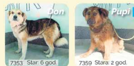
7353 Star: 6 god.