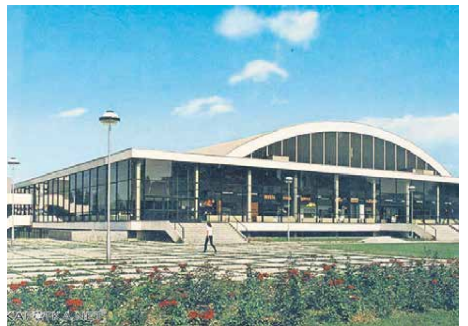
RAZGLEDNICA – SPORTSKA DVORANA 1980.