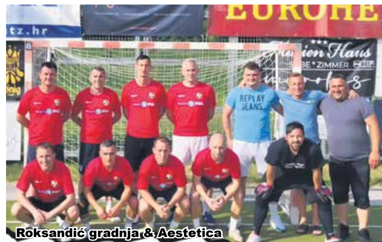
Roksandić gradnja & Aestetica