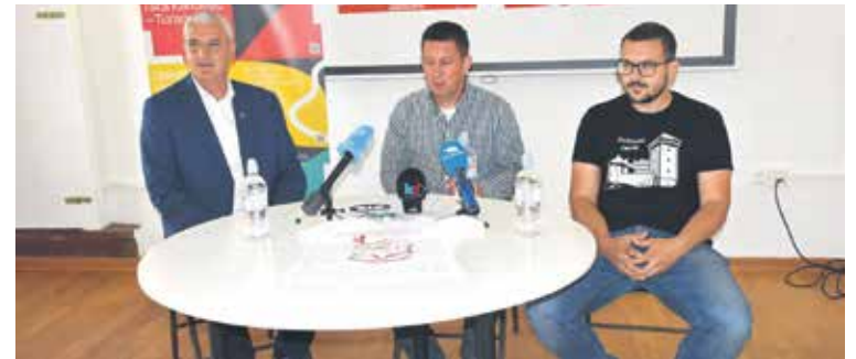
Dvanaesto izdanje atletske utrke "Karlovački cener"

•Ako sam dobro shvatio zračni program je više dvo-