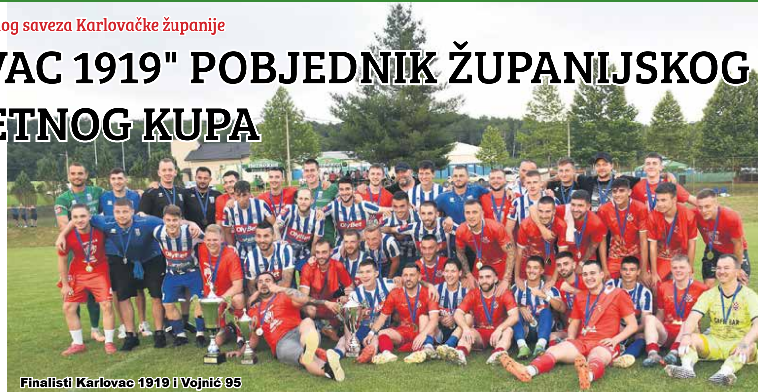
Finalisti Karlovac 1919 i Vojnić 95

Nogometni savez Karlovačke županije organizirao je u nedjelju, 9. lipnja u Žakanju na stadionu Nogometnog kluba "Croatia 78" tradicionalnu manifestaciju Dan nogometa Karlovačke županije. Program je počeo u 14 sati i 45 minuta revijalnim utakmicama mlađih uzrasta Nogometnog saveza Karlovačke županije i Nogometnog saveza Istarske županije, bile su to U-12 i U-13 selekcije. Nakon revijalnih utakmica održana je podjela pehara i priznanja najboljim klubovima i strijelcima u svim županijskim ligama u protekloj sezoni. Zatim je odigrana finalna utakmica Hrvatskog nogometnog kupa za područje Nogometnog saveza Karlovačke županije u kojoj su se sastali "Karlovac 1919" - "Vojnić 95". Pobjedio je "Karlovac 1919" s 1:0, nakon prvog poluvremena bilo je 0:0. Ivan Matyazh nije u 24. minuti iskoristio kazneni