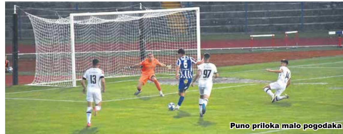
Puno priloka malo pogodaka