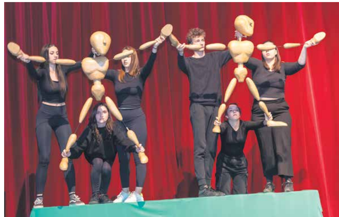
Kroz pet dana očekuje nas 13 predstava