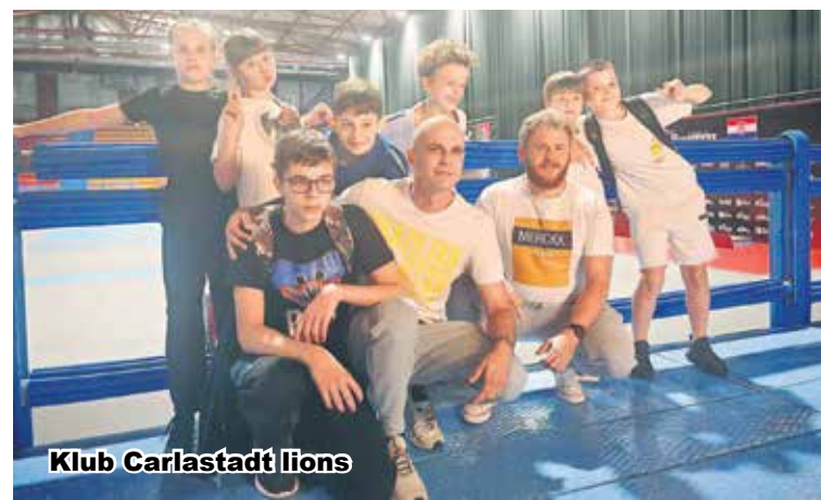
Klub Carlstadt lions

Klub brazilske jiu jitse "Carlstadt lions"