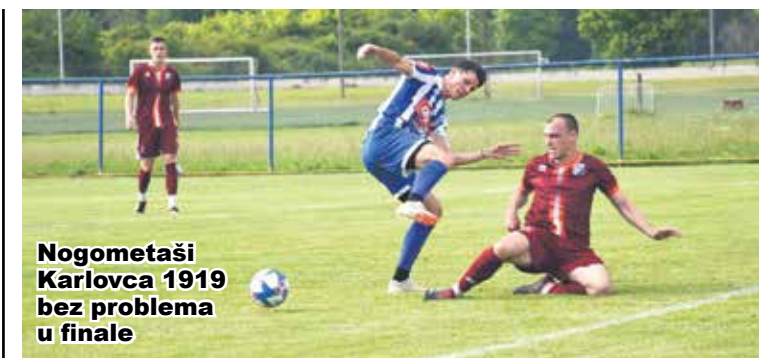
Nogometnaši Karlovca 1919 bez problema u finale