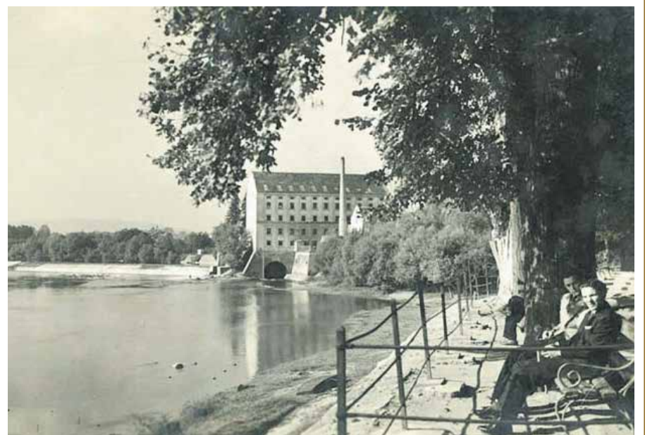
RAZGLEDNICA – KORANA