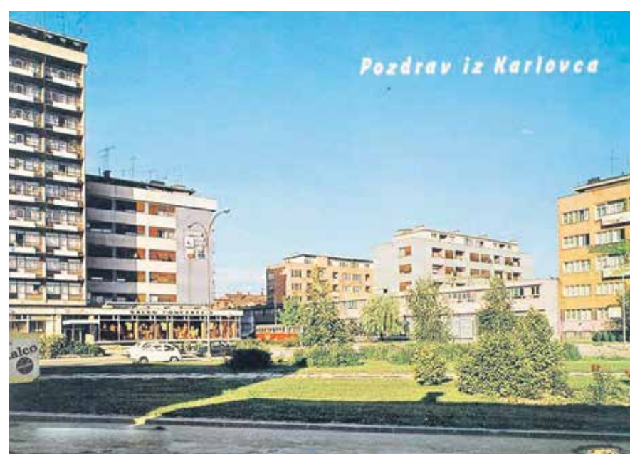
RAZGLEDNICA – POZDRAV IZ KARLOVCA (putovala 1970.-tih)