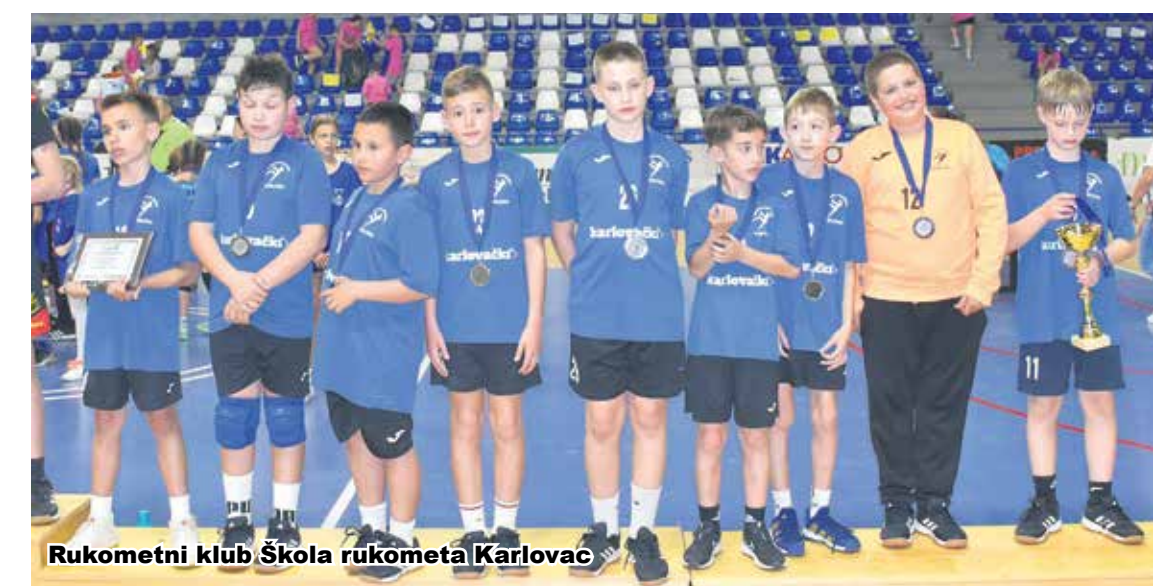
Rukometni klub Škola rukometa Karlovac

ca" iz Pizarovine, drugo "Po- reč" i treće "Drenak" iz Slunja. U konkurenciji dječaka rođenih 2015. godine prvo mjesto osvo- jila je "Arba Rab", drugo mjesto