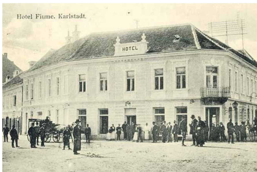
RAZGLEDNICA - HOTEL FIUME, KARLOVAC