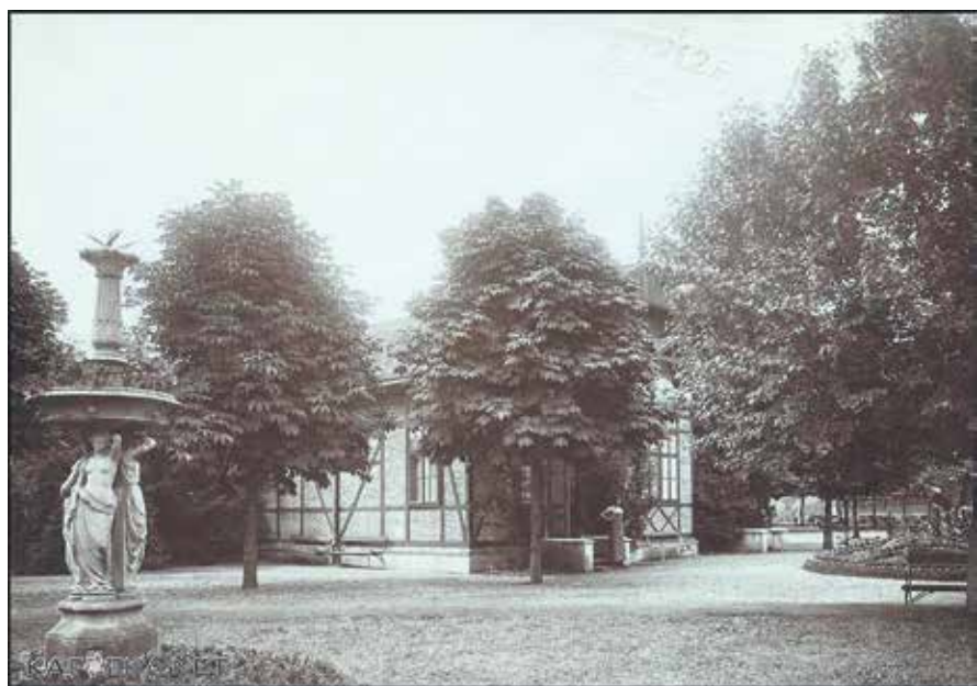
RAZGLEDNICA – KUPALIŠNI PERIVOJ 1912. GODINE