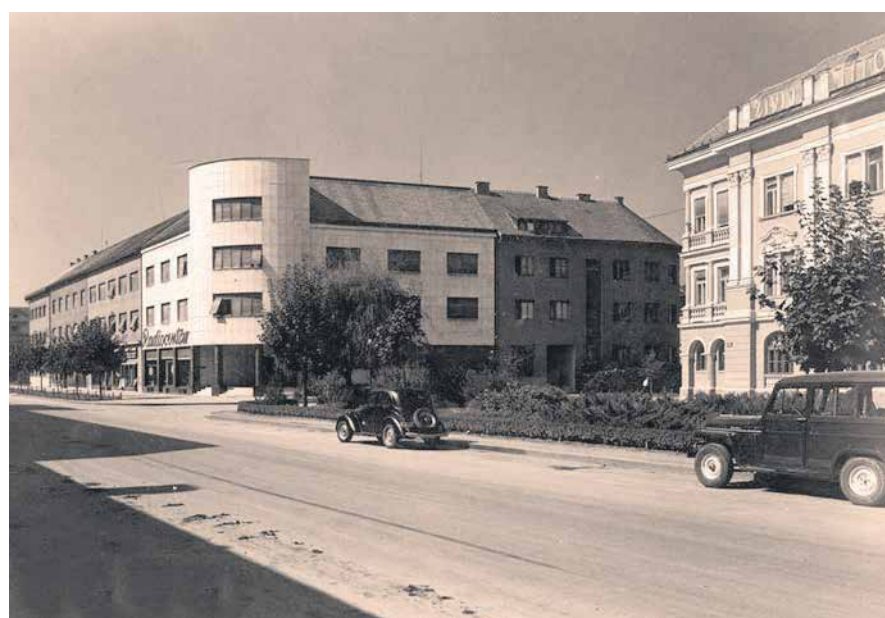
RAZGLEDNICA – KORZO