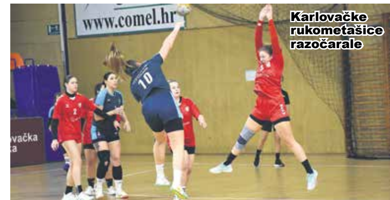
Karlovačke rukometašice razočarale

Seniorke Rukometnog kluba Škola rukometa Karlovac poražene su u subotu u Sportskoj dvorani na Rakovcu u dvanaestom kolu Druge hrvatske rukometne lige zapad za žene od ekipe "Liburnije-Opatije". Gošće su pobijedile s 29:22, a nakon prvog poluvremena vodile su s 12:10. Prije ove utakmice ekipa iz Opatije bila je šesta s dvanaest bodova, a Karlovačanke sedme s deset bodova. U prvom poluvremenu početak je pripao gostujućim igračicama, koje su povele 3:0, a zatim su vodile i 9:5. Domaće igračice došle su do 10:11, ali nisu uspjele izjednačiti. U drugom poluvremenu vrlo loša igra ekipe trenera Dražena Keče i dominacija gošćica iz Opatije te sigurna i uvjerljiva pobjeda. Bilo je to vrlo loše