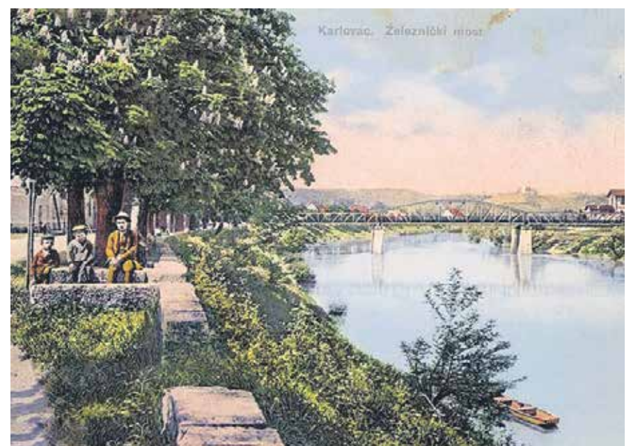
RAZGLLEDNICA - "ŽELEZNIČKI MOST"