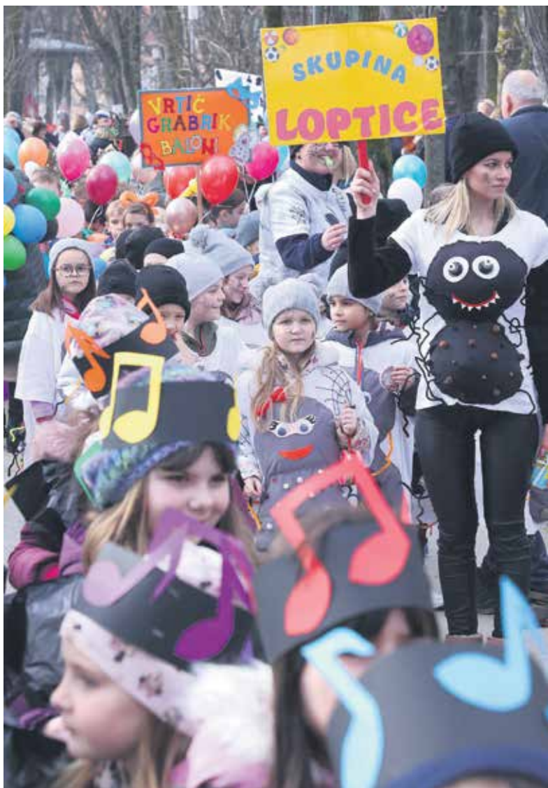
Maštovite kostime izradile su odgojiteljice i roditelji

Fašničku tradiciju u Karlovcu već nekoliko godina održavaju oni najmlađi i rijetki odrasli entuzijasti. Tako je vesela fašnička povorka vrtićanaca i ovog utorka na radost mnogih prodefilirala centrom grada. Podsjetimo, Dječju fašničku povorku, organiziraju dječji vrtići grada Karlovca, uz podršku Grada i sponzora. Sudjelovalo je 500-tinjak djece u pratnji svojih odgojiteljica. Bilo je maski i kostima mornara, zubić vila, pčelica, sovice, pužića, labudova i još mnogih drugih, za čiju izradu su se zajedno pobrinule odgojiteljice i roditelji djece na radionicama održanim povodom maškara. Male su se maske okupile kod žabe i prošetale Korzom do kružni toka kod OŠ Braće Seljan pa Domobranskom ulicom do Sokolskog doma i završile s defileom kod Glazbenog paviljona. Tamo je za njih bio priređen zabavni program, odabrane su tri najoriginalnije maske te druženje uz krafne. Na manifestaciji su dakle sudjelovala djeca Dječjeg vrtića Karlovac, Dječjeg vrtića Četiri rijeke, Dječjeg vrtića Tintilinić, obrta za čuvanje djece s područja grada te Dječjeg odjela Gradske knjižnice I. G. Kovačić.