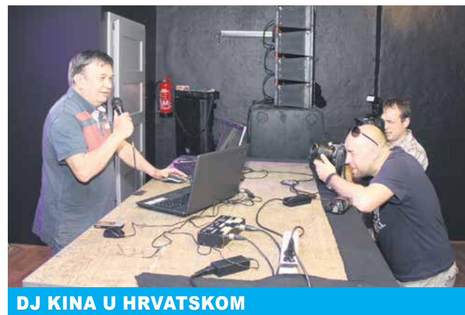
DJ KINA U HRVATSKOM

skom domu neće biti, prihvatio sam ponudu. Odmah smo počeli s pripremanjima i čim je završila sezona na Foginovom kupalištu, krenuli smo s discom u Sportskoj dvorani. Dosta smo obnovili opremu i iako se radilo o hodniku, izgledalo je super. Od prvog dana posjeta je bila sjajna.