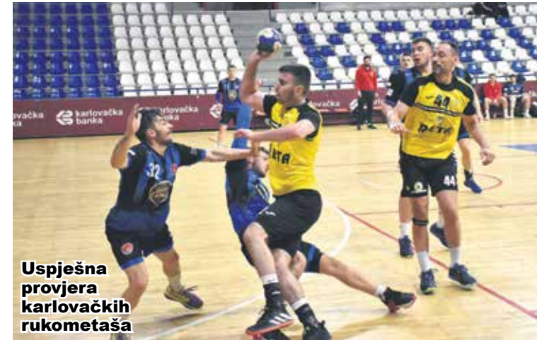
Uspješna provjera karlovačkih rukometaša