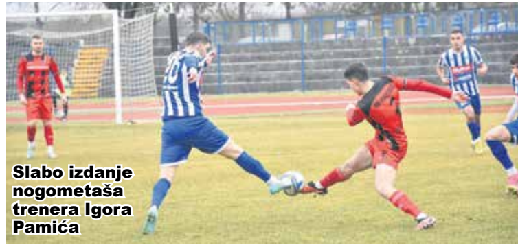
Slabo izdanje nogometaša trenera Igora Pamića

Nogometaši "Karlovca 1919" odigrali su u subotu na Stadionu "Branko Čavlović Čavlek" pripremnu utakmicu s momčadi "Kurilovca" iz Velike Gorice, koja je član Treće nogometne lige Središte. Susret je završio bez pobjednika 1:1, a nakon prvog poluvremena gosti su vodili s 1:0. Nakon odličnih utakmica na turniru u Medulinu i osvajanja drugog mjesta u natjecanju s prvoligašima i drugoligašima, navijači su očekivali dobru igru i pobjedu. No, karlovački nogometaši na svom stadionu prikazali su slabu igru, bilo je puno pogrešaka, a dobar dio igrača nije bio raspoložen.