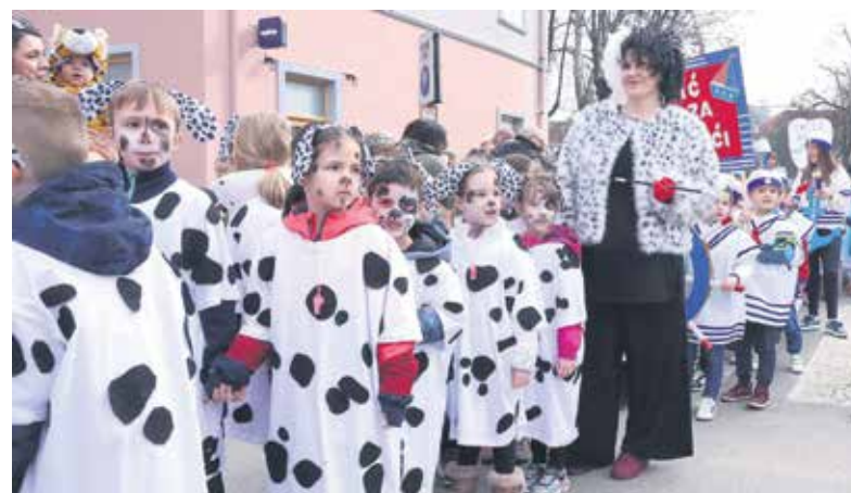
NAJMLAĐI ODRŽAVAJU TRADICIJU