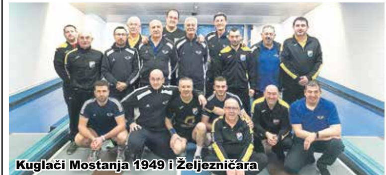
Kuglači Mostanja 1949 i Željezničara

Proteklog vikenda odigrani su prvenstveni susreti u tri kuglačke lige u kojima igraju klubovi iz karlovačke županije. Odigrani su susreti dvanaestog kola Prve hrvatske kuglačke lige jug. "Kupa" je poražena u Zadru od "Poličnika". Domaćin je bio bolji sa 6:2. "Korana" je nadigrala na kuglani u Slunju "Bojovnika" iz Trilja sa 6:2. Proteklog vikenda odigrani su susreti šesnaestog kola Druge hrvatske kuglačke lige zapad za muške. Kuglači "Mostanja 1949" pobijedili su na kuglani Doma Oružanih snaga "Zrinski" u karlovačkom derbiju momčad "Željezničara" sa 7:1. Kuglači "Rakovice" nadigrali su na kuglani Hotela "Jezero" na Plitvicama momčad "Obrtnika" iz Ogulina sa 6:2. Odigrani su susreti četrnaestog kola Druge hrvatske kuglačke lige jug za žene. "Ogulin" je poražen na kuglani u Ogulinu od ekipe "Šubičevca" iz Šibenika. Gošće su bile bolje s 5:3. "Kupa" iz Ozlja nadigrala je u Delnicama "Goranina" sa 6:2. "Karlovac" je pobijedio u Zaprešiću ekipu "Zaprešića" s 5:3. (b.o.)