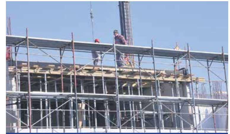
ŠKOLU ČEKA ENERGETSKA OBNOVA

ncijiranom iz NPOO, Karlovačka županija je pokrenula dogradnju Medicinske škole Karlovac te istu financira