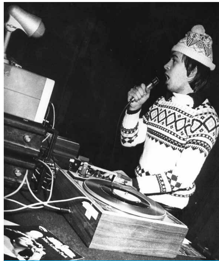
DJ KINA U HRVATSKOM

U to sam vrijeme dosta ozbiljno studirao i htio sam što prije dočepati se diplome na Višoj građevinskoj školi. Do kraja sezone u Hrvatskom domu bili