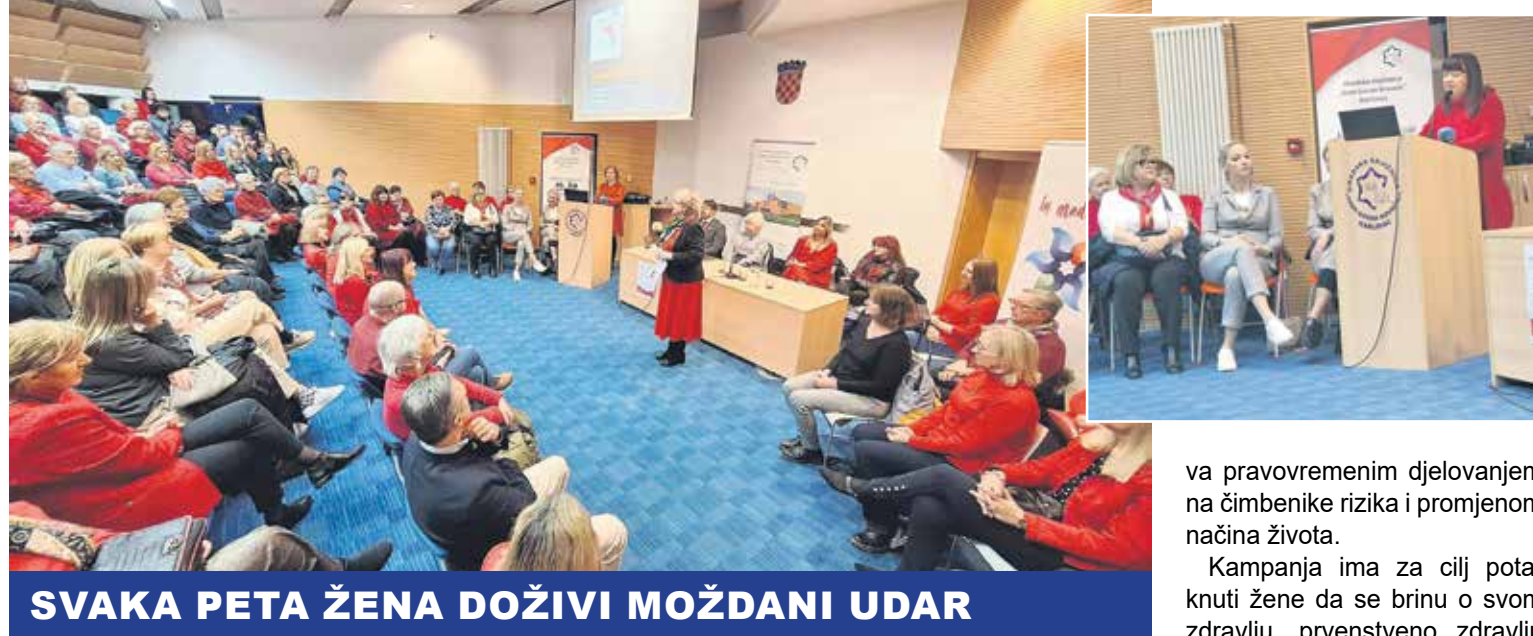
SVAKA PETA ŽENA DOŽIVI MOŽDANI UDAR