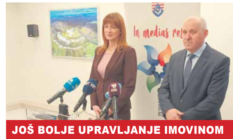
JOŠ BOLJE UPRAVLJANJE IMOVINOM

Uvjeren je da će se ovim Zakonom ubrzati raspolaganje državnom imovinom jer svatko od tih predmeta predstavlja rješavanje nekog projekta značajnog za život građana pojednog dijela županije. Govoreći o stanogradnji ministar Bačić je rekao: -Na području Karlovačke županije imamo više različitih vrsta ulaganja u stambeni fond; bilo da se radi o postpotrebnosti obnovi gdje je završeno 145 obnova, a 37 ih je u tijeku. S druge strane kroz projekt energetske obnove, obnavlja-