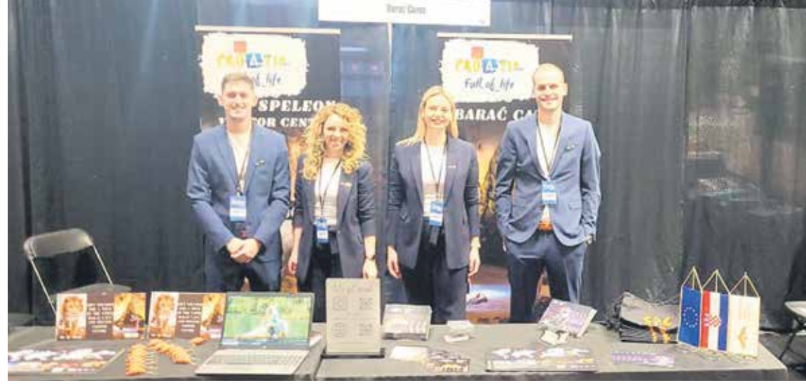
Leading New Tourist Attraction 2024, odnosno Najbolja nova turistička atrakcija Euro-

Na Facebook-u JU Baračeve špilje objavili su da su nominirani za World Travel Awards 2024 u kategoriji Europe's