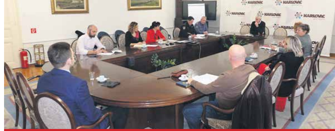
NEMA PORASTA BROJA NASILJA U ŠKOLAMA