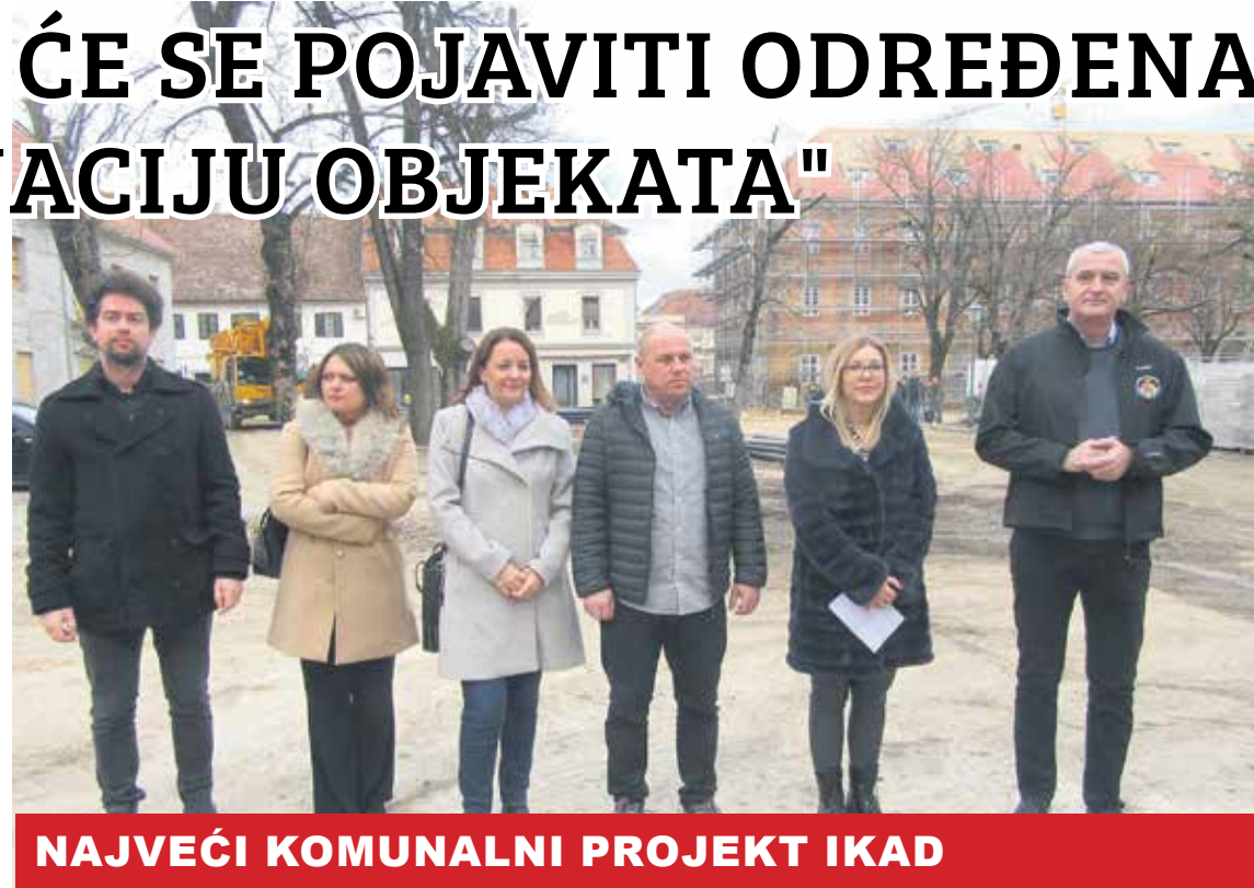
NAJVEĆI KOMUNALNI PROJEKT IKAD

-S razine gradske uprave smo već prije dvije godine bili svjesni zahtjevnosti projekta i cijelo to vrijeme smo komunicirali da ćemo u jednom trenutku vjerojatno morati svi zajedno