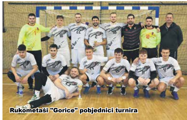
Rukometaši "Gorice" pobjednici turnira