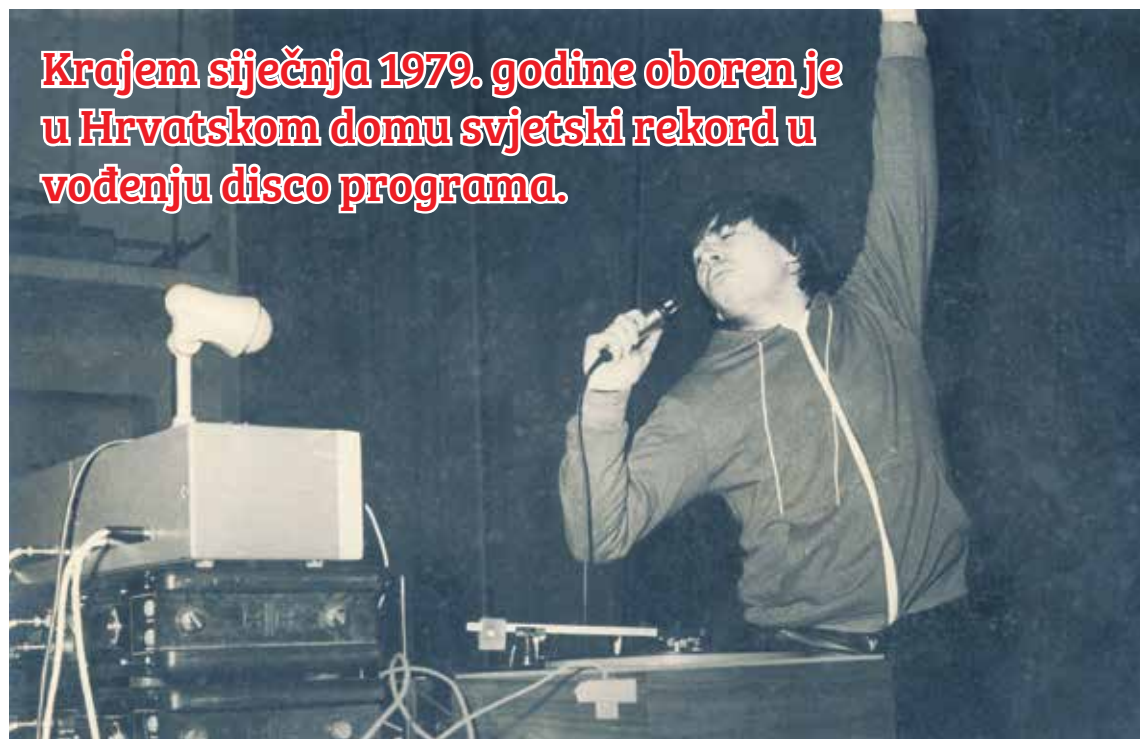
DJ KINA U HRVATSKOM

Krajem siječnja 1979. godine oboren je u Hrvatskom domu svjetski rekord u vođenju disco programa.