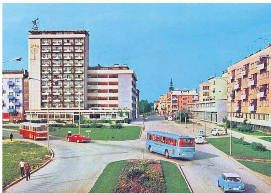
RAZGLEDNICA DOMOBRANSKA ULICA, KARLOVAC