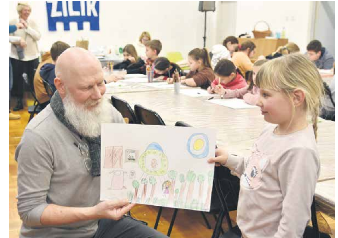
UMJETNICI ZA DJECU