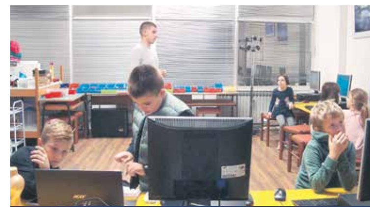
80 POLAZNIKA RADIONICA

Kao i ranijih godina (od svog osnutka 1993. godine) i ove godine je Udruga informatičara Karlovačke županije u suradnji sa Zajednicom tehničke kulture i Karlovačkom županijom – Upravnim odjelom za školstvo, organizirala Zimsku školu informatike koja je održana od 27. prosinca 2023. do 5. si-