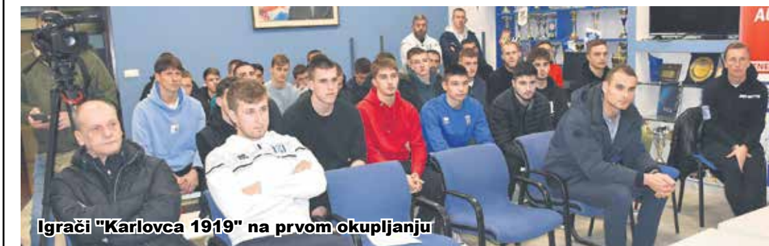
Igrači "Karlovca 1919" na prvom okupljanju