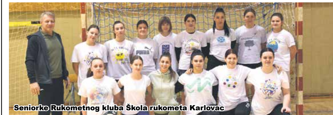
Seniorke Rukometnog kluba Škola rukometa Karlovac