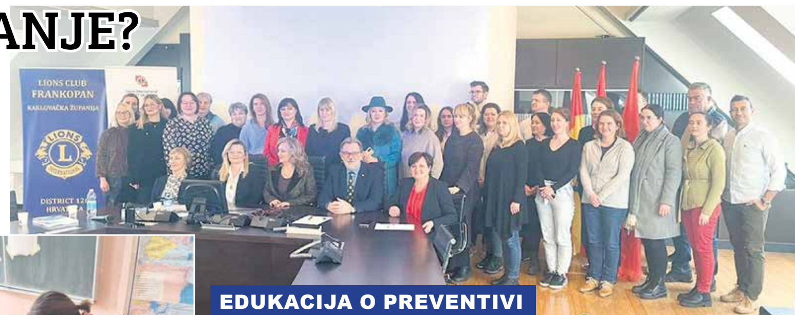
EDUKACIJA O PREVENTIVI

Održana je dvodnevna edukacija za implementaciju preventivnog programa LQ - Vještine za adolescenciju za učitelje osnovnih škola Karlovačke županije, a u organizaciji Agencije za odgoj i obrazovanje Karlovačke županije te potporu Lions cluba Frankopan.