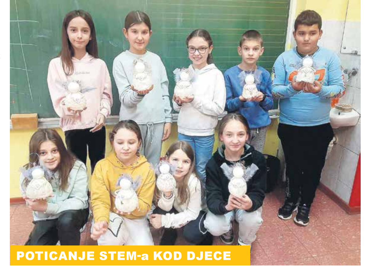
POTICANJE STEM-a KOD DJECE

Glavni dio projekta provest ćemo u suradnji s hrvatskom tvrtkom CircuitMess koja proizvodi edukacijske komplekte koje korisnici sami slažu, te su namijenjene upravo poticanju zanimanja za STEM discipline već od najranije dobi. Uz njihove edukacijske komplekte učenici kroz cijelu nastavnu godinu mogu na zabavan način učiti o programiranju, elektronici, računarstvu, robotici i mehanici. Ponosni smo što je ova - sada već svjetski poznata - tvrtka pristala na suradnju s našom školom, tim više što znamo da je krenula iz Karlovca kao ideja našeg mladog inovatora i uspješnog poduzetnika - Alberta Gajšaka, ističu u OŠ Turanj.