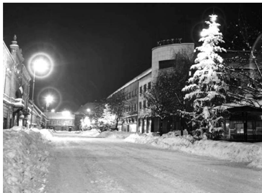
RAZGLEDNICA /ČESTITKA - ZRINSKI TRG 1967.