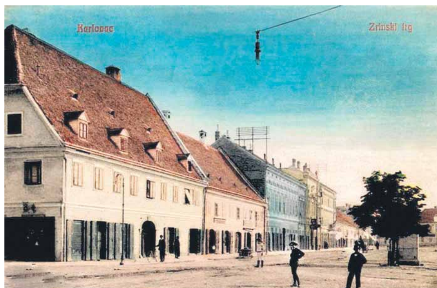
RAZGLEDNICA - ZRINSKI TRG