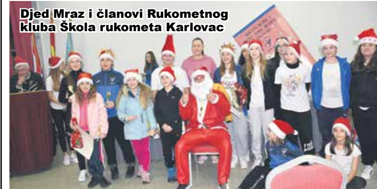
Djed Mraz i članovi Rukometnog kluba Škola rukometa Karlovac