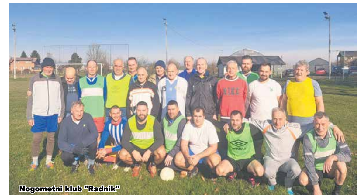
Nogometni klub "Radnik"

grano je 89 međusobnih haklova na kojima su nastupila 32 igrača. Tijekom godine odigrani su prijateljski susreti s veteranima "Mostanja", nastupili su na Krku na memorijalnom turniru "Fortunato Sokolici" te osvojili drugo mjesto u konkurenciji momčadi "Krk-a", "Kvarnera 2007" iz Rijeke i "Omladinca" iz Jospovca. Uspješno su organizirani 3. Karlovački festival sportske rekreacije, u konkurenciji četiri momčadi osvojeno je prvo mjesto, tradicionalni susret povodom Ivanjskog krijesa Banija-Gaza te tradicionalni turnir u spomen na Slavka Loknara i Branka Marletića, osvojeno drugo mje-