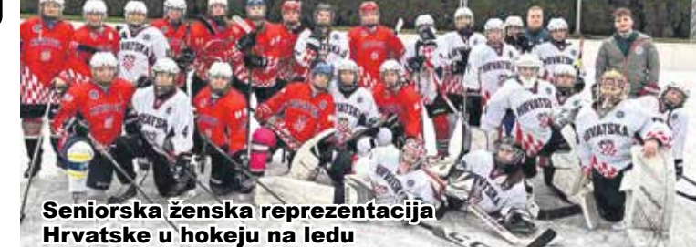
Seniorska ženska reprezentacija Hrvatske u hokeju na ledu

Pred blagdane u Karlovcu je održana selekcija ženske reprezentacije Hrvatske u hokeju na ledu. Na širem spisku našlo se čak deset karlovačkih igračica iz Inline hokej kluba "Karlovac". Seniorke iz svih hrvatskih klubova odradile su prvi zajednički trening i međusobnu utakmicu. Svjetsko prvenstvo u hokeju na ledu za žene 2024. godine bit će održano u Zagrebu tijekom ožujka. (b.o.)