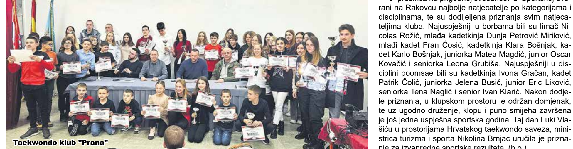
Taekwondo klub "Prana"