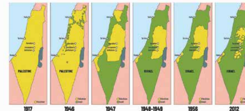
Grafičko odlikovanje i tekst: TISKARA PEČARIC I RADOČAL, Karlovac