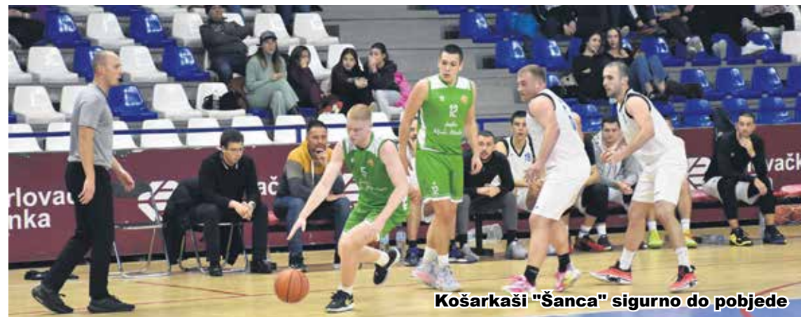
Košarkaši "Šanca" sigurno do pobjede