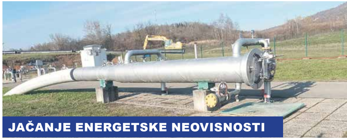
JAČANJE ENERGETSKE NEOVISNOSTI

To je pravodobna investicija, korištenje inteligentno europskih sredstava u trenutku najveće energetske krize s pogledom na energetska tranziciju i na nove energente, poručio je premijer Plenković