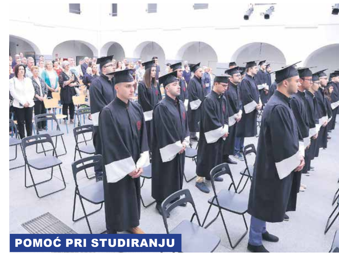
POMOĆ PRI STUDIRANJU

Inače, kroz sustav stipendiranja, od njegovog uvođenja 1994. godine, stipendiju Karlovačke županije dobio je 1721 kandidat, od toga 717 učenika, 986 studenata i 18 posljediplomaca. Za stipendije je dosad u županijskom proračunu osigurano više od milijun i 300 tisuća eura.