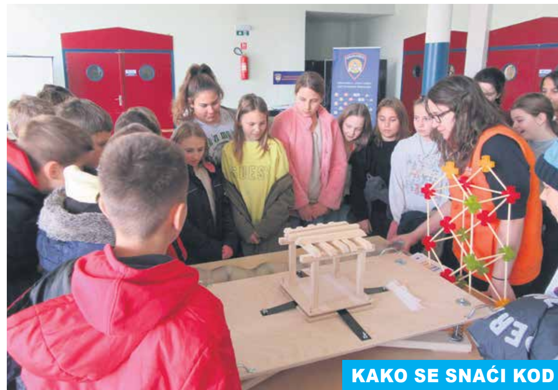
KAKO SE SNAČI KOD PRIRODNIH NEPOGODA

Edukacija pod nazivom „Usvoji znanja da šteta bude manja“ održana je prošlog četvrtka u predvorju školske sportske dvorane OŠ Grabrik.