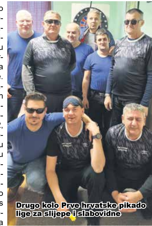
Drugo kolo Prve hrvatske pikado lige za slijepce i slabovidne