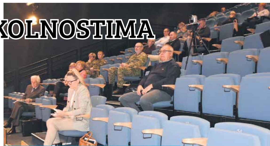
DVODNEVNI ZDRASTVENI SIMPOZIJ

udruga medicina u okolnostima katastrofa, Hrvatsko društvo za anesteziologiju, reanimatologiju i intenzivnu medicinu, Hrvatsko društvo za hitnu medicinu i Opća bolnica Karlovac. Pokrovitelji su bili Karlovačka županija i Grad Karlovac. Teme simpozija bile su katastrofe, uzroci,