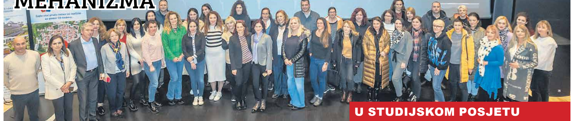
U STUDIJSKOM POSJETU

Grad Karlovac je s kolegama iz gradova i općina koji čine Urbanu aglomeraciju Split razmijenio iskustva iz sudjelovanja u ITU mehanizmu, te pokazao kako izgledaju oni već realizirani zahvaljujući tom mehanizmu: Kino Edison, Nikola Tesla Experience Center i obnovljeni vrelovidi.