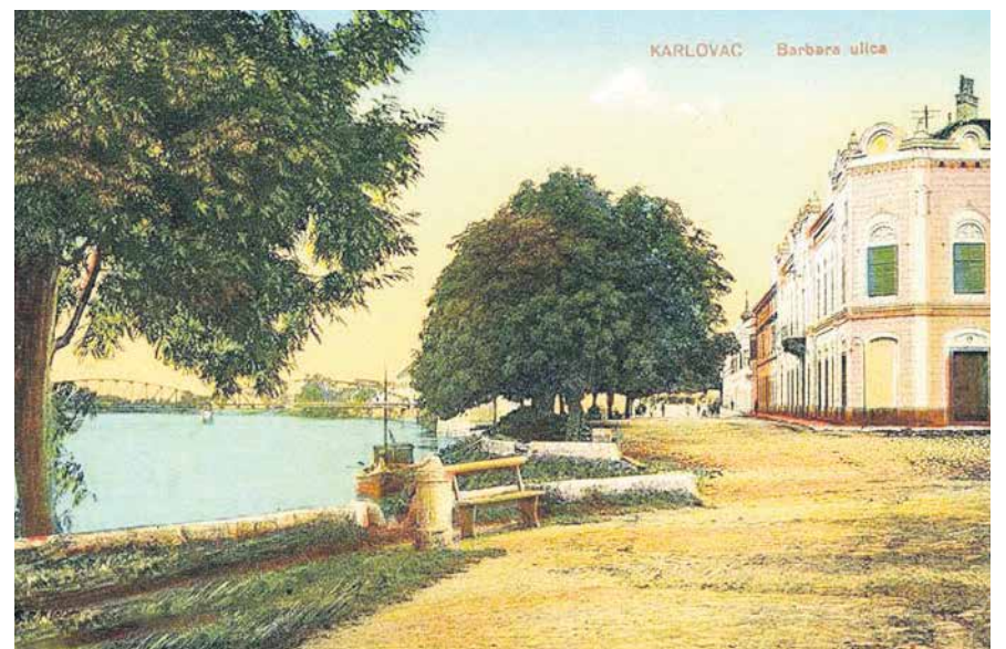
RAZGLEDNICA - BARBARINA ULICA (danas Obala Vladimira Mažuranića)