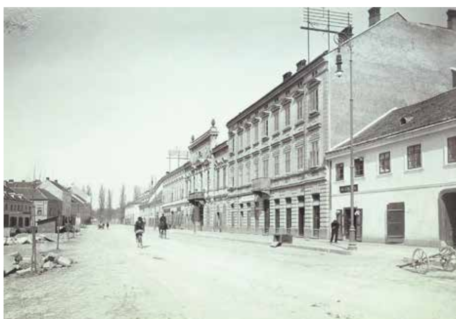
Razglednica - Korzo 1912. godine