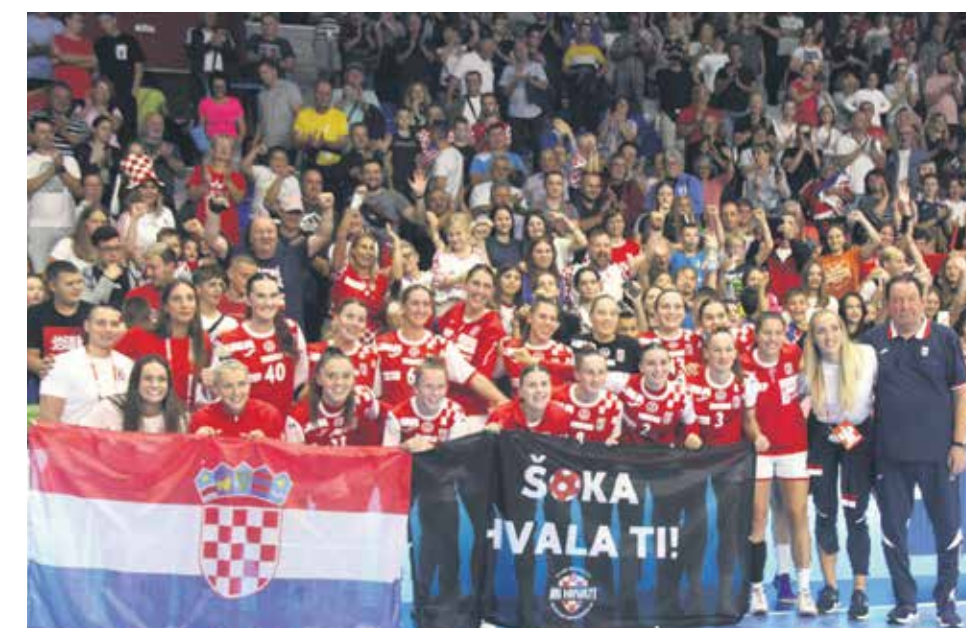
Hrvatske rukometašice uz karlovačku publiku

Kvalifikacije za Europsko prvenstvo u rukometu za žene 2024. godine