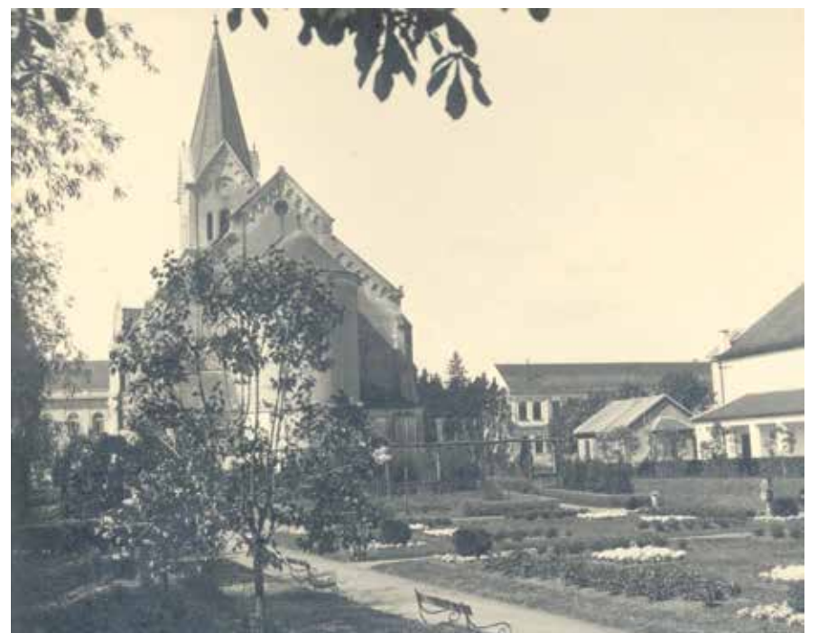
Razglednica - Modrušanov park, putovala 1938. godine