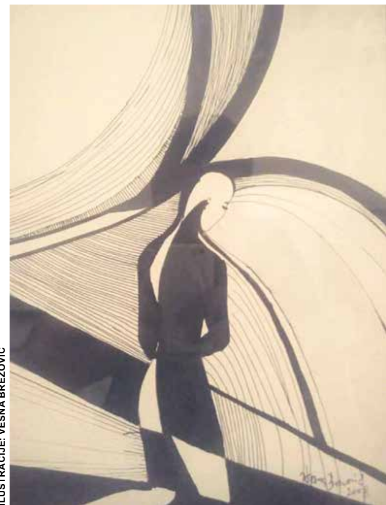
ILUSTRACIJE: VESNA BREZOVIC

Vratio u sobu. Spuštajući opran, dezinficiran lavor, lakotom je zakačio kutiju na noć-