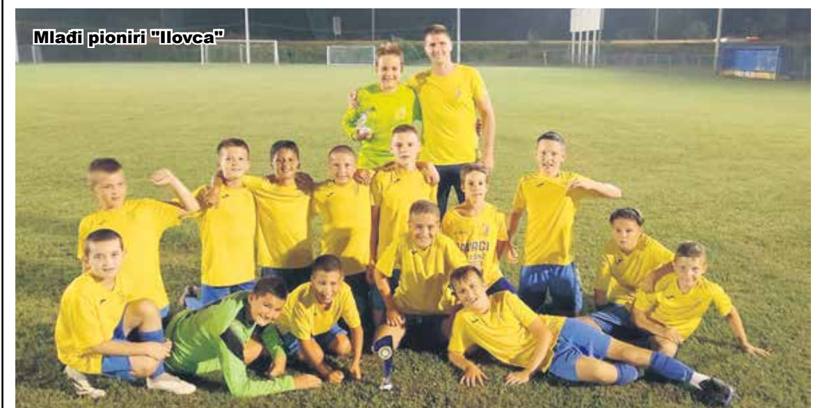
Mladi pioniri "Ilovca"

Nogometni klub "Mostanje" organizirao je na igralištu u Mostanju 11. Memorijalni turnir mladih pionira "Marijan Milčić". Sudjelovalo je šest ekipa s područja Nogometnog saveza Karlovačke županije "Karlovac 1919", "Ilovac", "Josipdol", "Ogulin", "Barilović" i "Mostanje". Igralo se u dvije skupine s po tri momčadi, u završnici su se plasira-