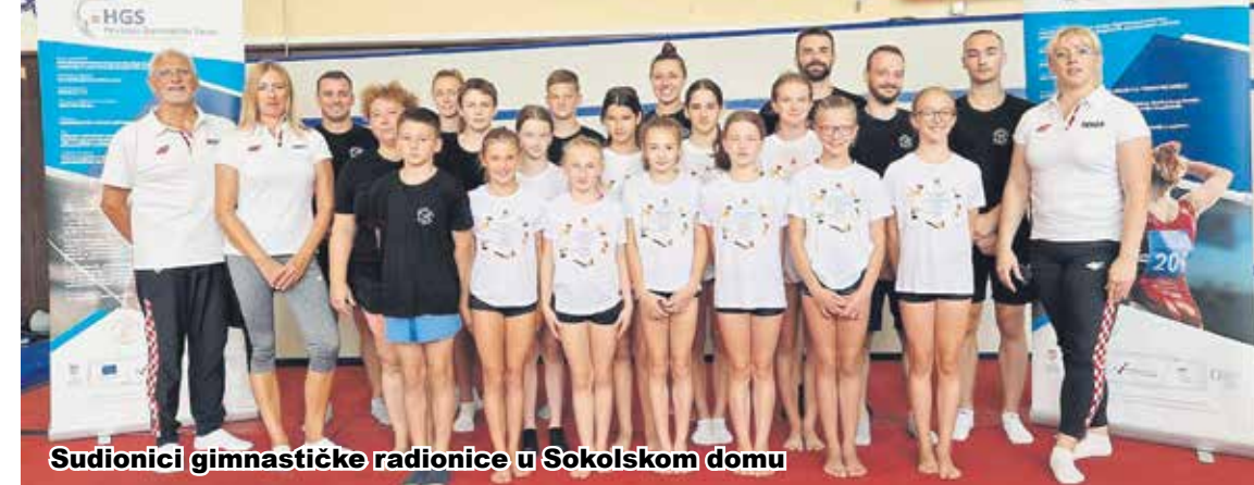
Sudionici gimnastičke radionice u Sokolskom domu

Gimnastički klub "Sokol" Karlovac bio je domaćin i aktivni sudionik u projektu Hrvatskog gimnastičkog saveza. HGS, kao krovna gimnastička institucija je, između ostalih aktivnosti pokrenula i projekt pod nazivom Jačanje kapaciteta kroz izradu digitalnog priručnika, edukaciju i organizaciju besplatnih gimnastičkih sadržaja. Ukupna vrijednost ovog projekta je 65.936,61 euro. Sam projekt sastoji se od tri segmenta koji su sadržani u aktivnostima. Prvi segment je izrada digitalnog priručnika, edukativni materijal s prikazom i opisom vježbi iz sportske gimnastike, isto je realizirano tijekom jeseni 2022. godine i snimljeno više od 300 vježbi gimnastičkog sa-