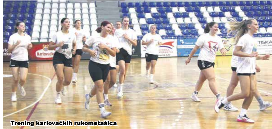
Trening karlovačkih rukometašica

Seniorke Rukometnog kluba Škola rukometa Karlovac počele su tijekom proteklog tjedna u Sportskoj dvorani na Rakovcu s pripremama za novo prvenstvo u Drugoj hrvatskoj rukometnoj ligi zapad za žene. Prvi trening počeo je u srijedu, 16. kolovoza u 17 sati i