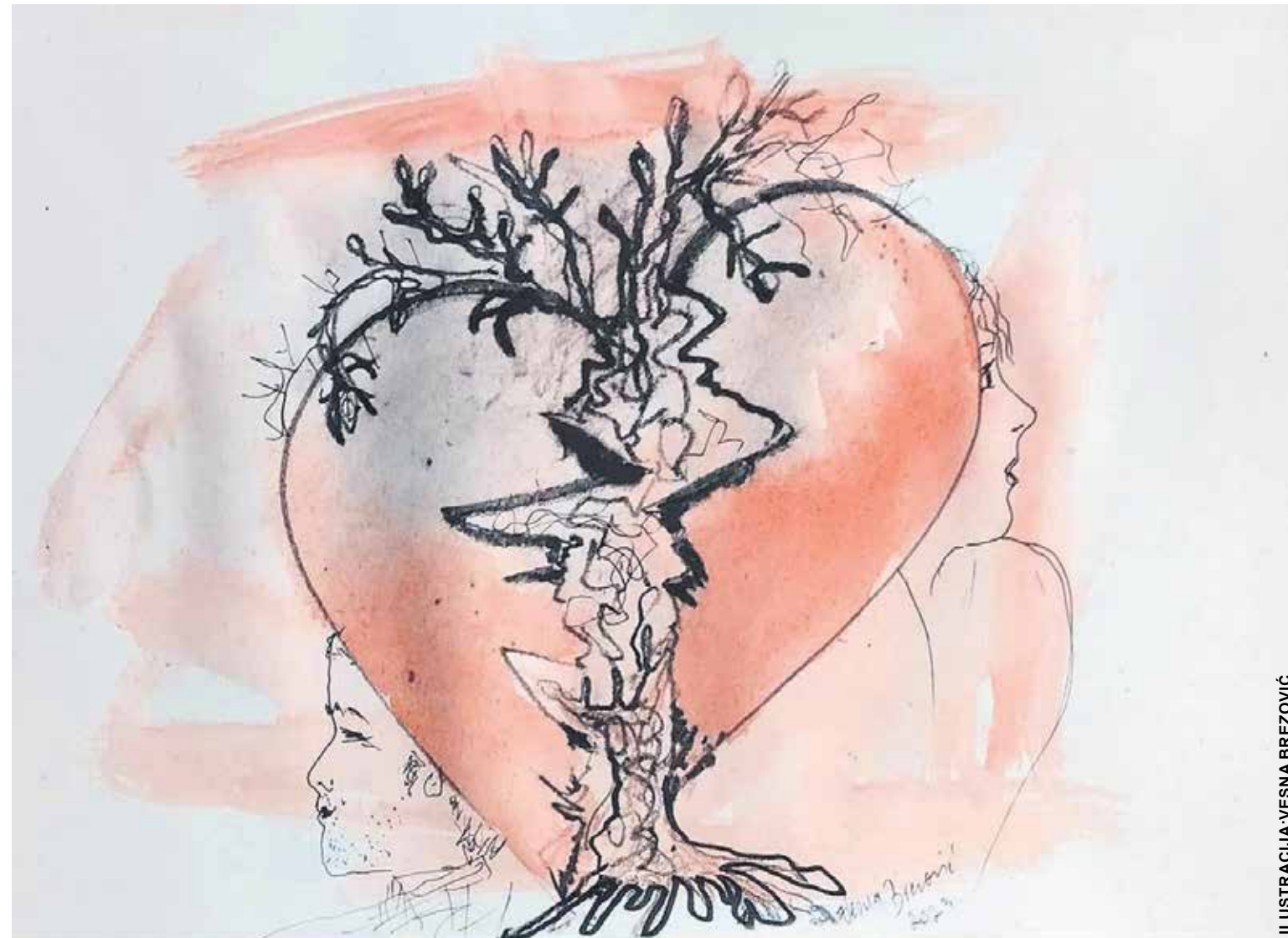
ILUSTRACIJA: VESNA BREZOVIC

Moja istina je da se tata i mama toliko mrze, da su zaboravili na nas, a kad ih silom pri-lika podsjetimo na to da smo