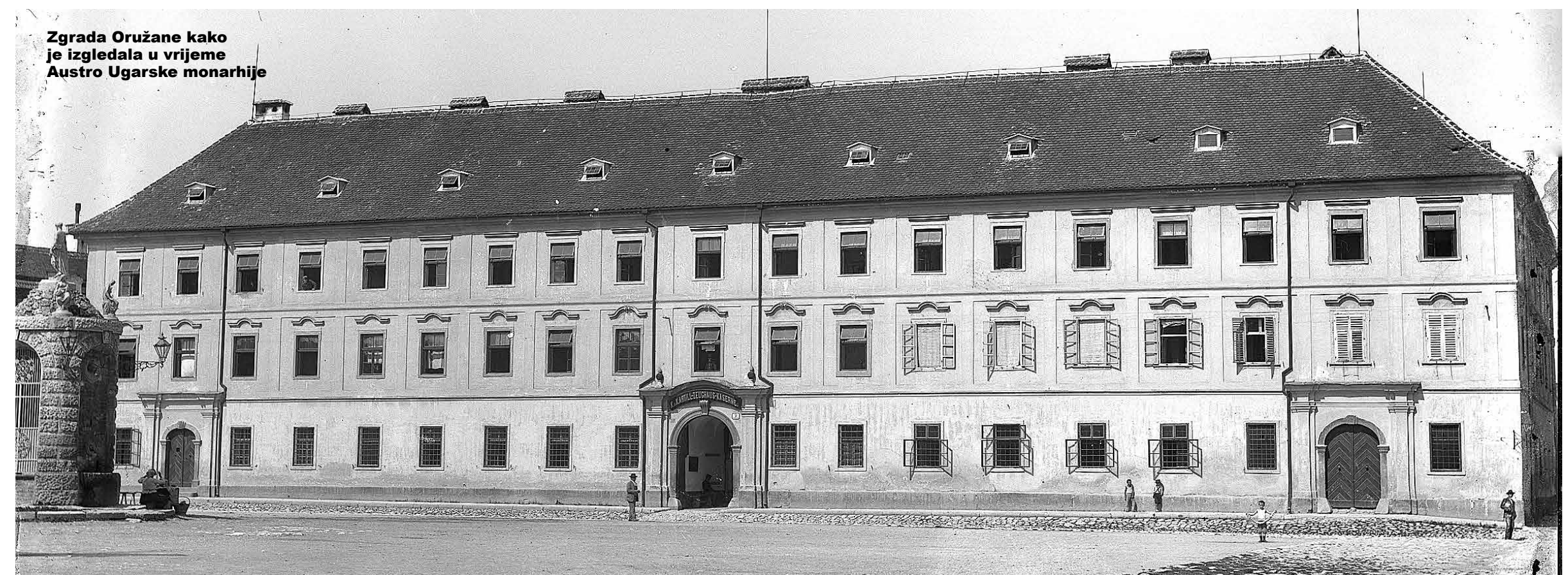
Zgrada Oružane kako je izgledala u vrijeme Austro Ugarske monarhije

„U odnosu na planirani rok završetka, došlo je do određenog kašnjenja u dinamici izvođenja radova zbog nekoliko čimbenika, prije svega zbog problema u isporuci pojedinog građev-