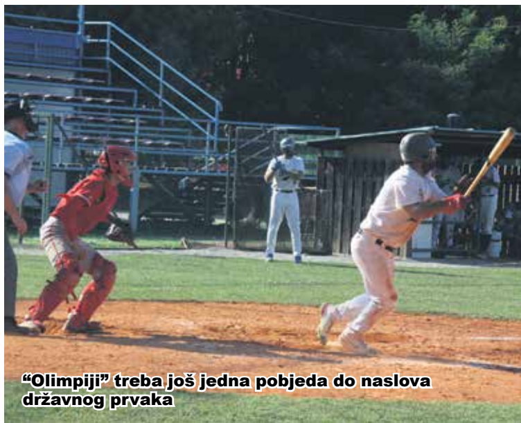
"Olimpiji" treba još jedna pobjeda do naslova državnog prvaka

Baseball klub "Olimpija" nakon četiri utakmice finalne serije za prvaka Hrvatske vodi s 3:1 protiv "Vindije" iz Varaždina, a peti susret, koji se trebao igrati u Varaždinu proteklog vikenda dva put je odgođen zbog lošeg vremena, i u subotu i u nedjelju. U subotu je čak susret počeo, ali je prekinut u drugom inningsu zbog kiše. Prve dvije utakmice finala Prvenstva Hrvatske odigrane su na igralištu u