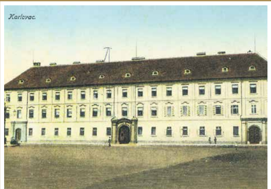
Razglednica (putovala 1925. godine)