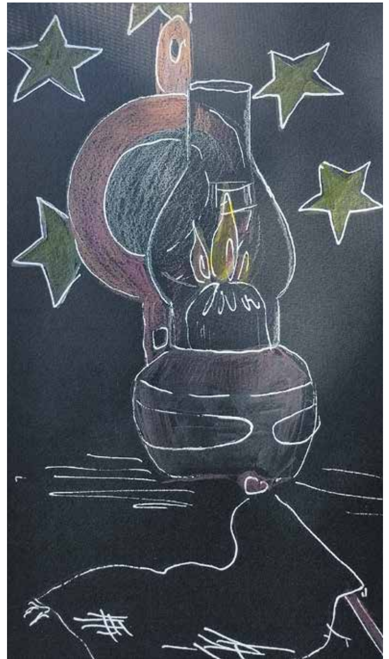
ILUSTRACIJA: VESNA BREZOVIĆ