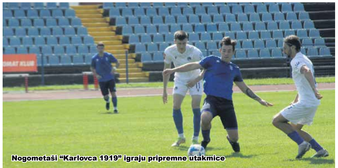
Nogometnaši "Karlovca 1919" igraju pripremne utakmice